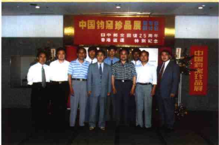
◎ 中国钧窑珍品展在日本东京中日友好会馆开幕