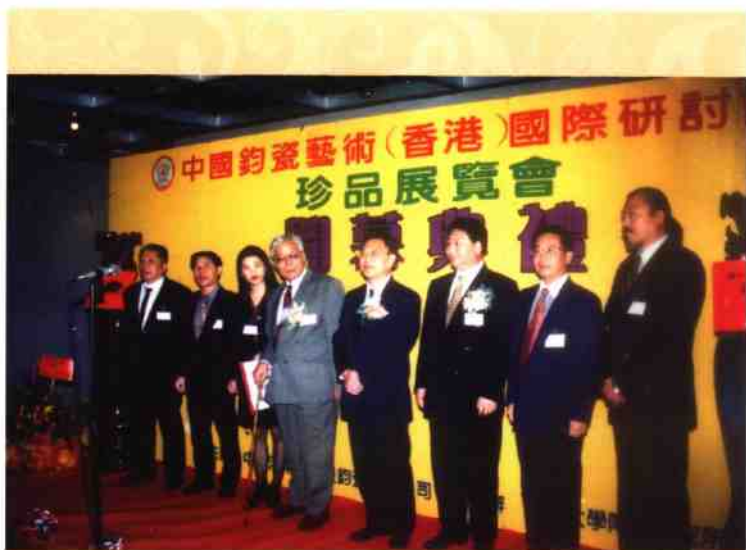
◎ 中国钧瓷艺术(香港)国际研讨会暨钧瓷珍品展览会开幕式现场