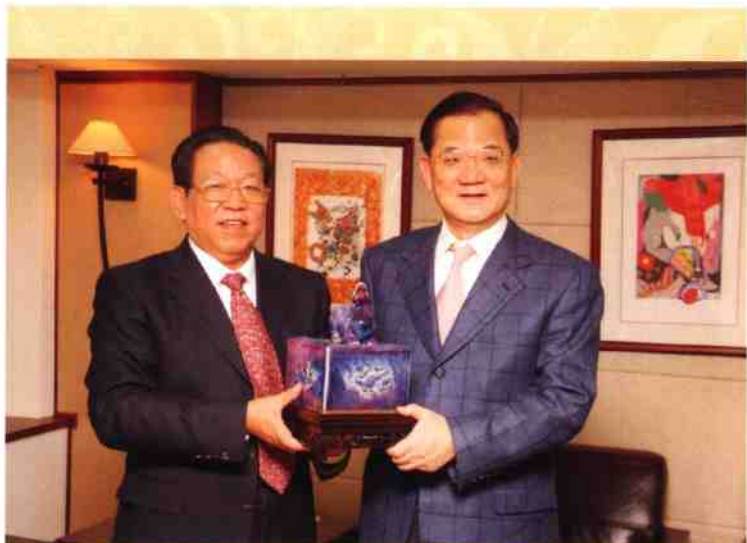
◎ 中国国民党名誉主席连战接受“千钧印”