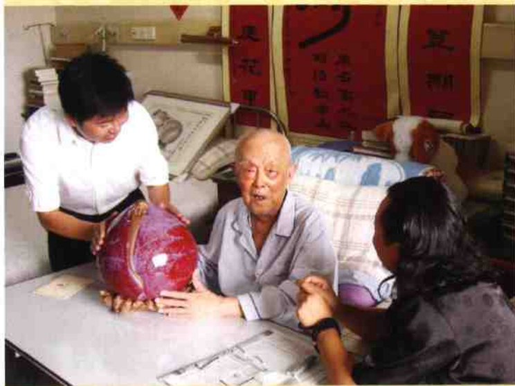
◎ 国学大师季羨林接受钧瓷“福寿桃”