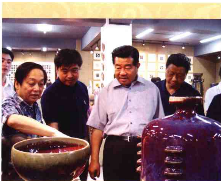
◎ 全国政协主席贾庆林参观韩美林钧瓷作品展