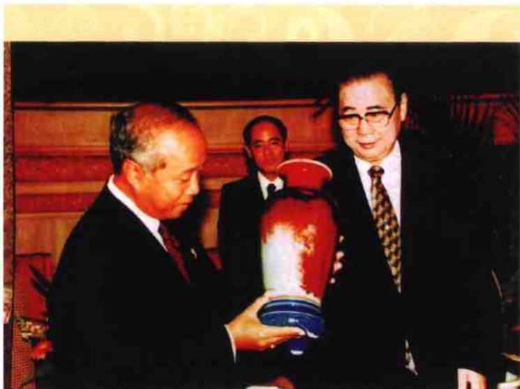
◎ 原全国人大常委会委员长李鹏向柬埔寨拉那列亲王赠送礼品