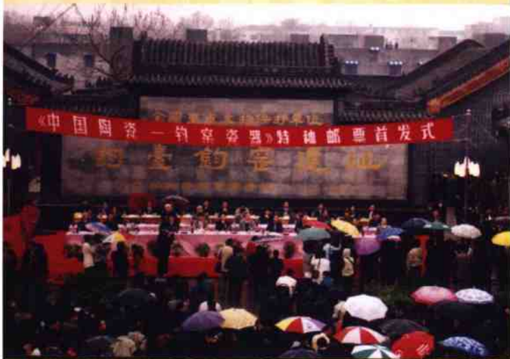
◎ 钧瓷邮票发行现场