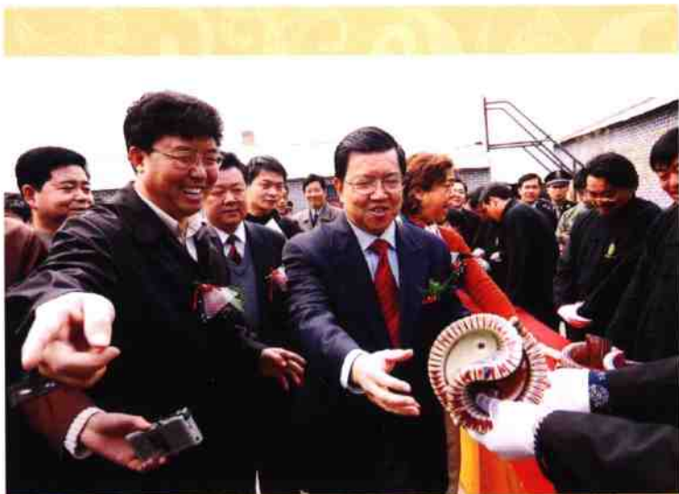
◎ 许昌市委书记毛万春与亚洲博鳌论坛秘书长龙永图参加“华夏瓶”开窖仪式