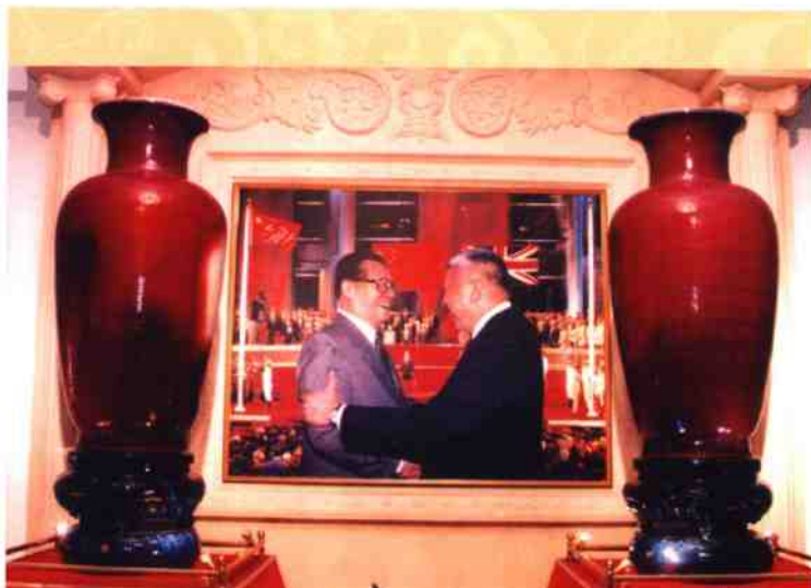
◎ 河南省人民政府喜迎香港回归的贺礼“豫象送宝”