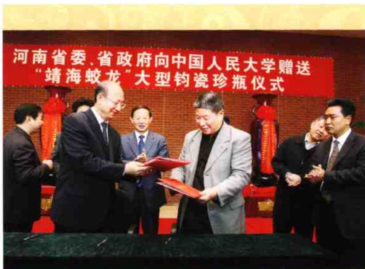
◎ 孔家钧窑制作的“靖海蛟龙”瓶被中国人民大学收藏