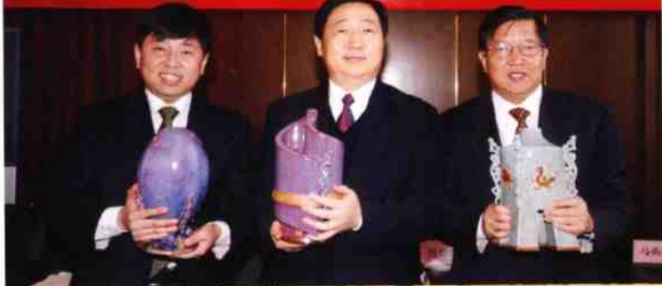
◎ 中国国家博物馆收藏“祥瑞瓶”、“乾坤瓶”、“华夏瓶”