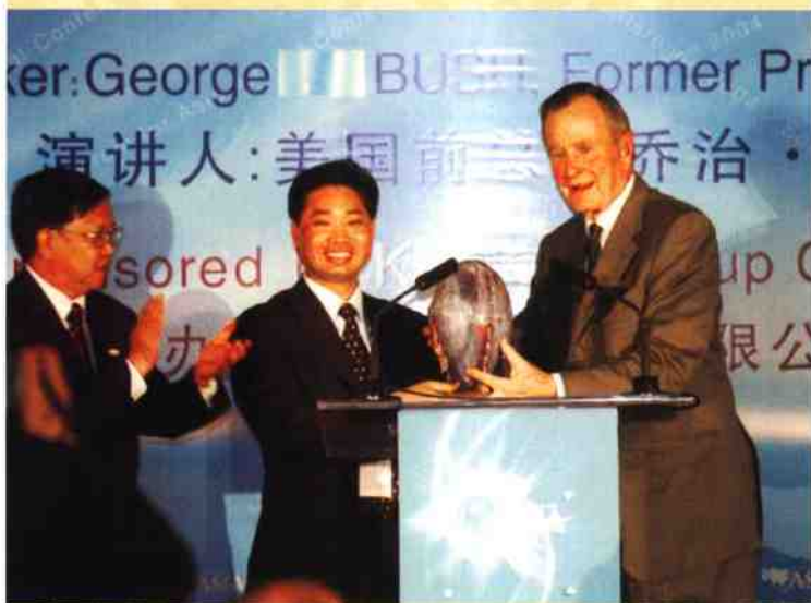
◎ 美国前总统布什接受“乾坤瓶”