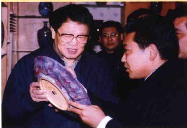
◎ 孔家钧窑总经理孔红生向全国人大常委会副委员长李铁映汇报钧瓷烧制工艺