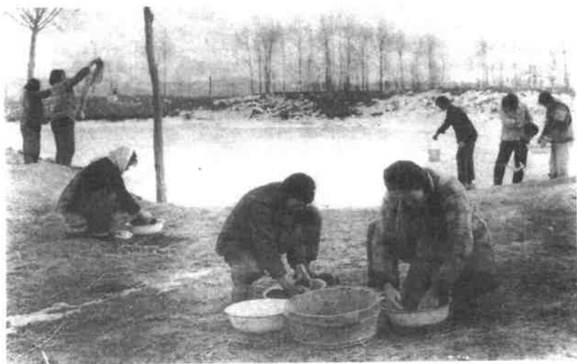
“八姐妹”利用工休日，帮助单身职工洗衣服