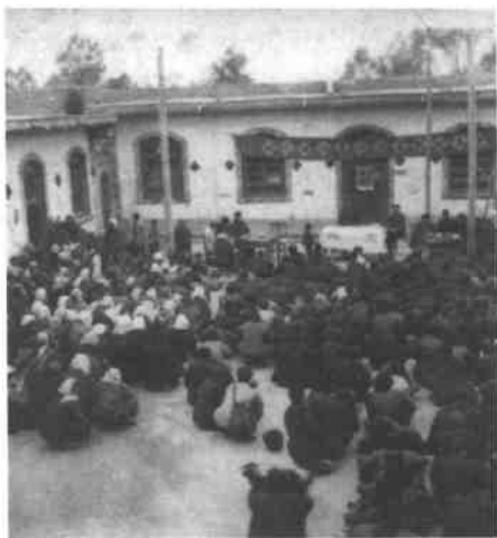
◀ 当地群众欢迎支宁青年到来