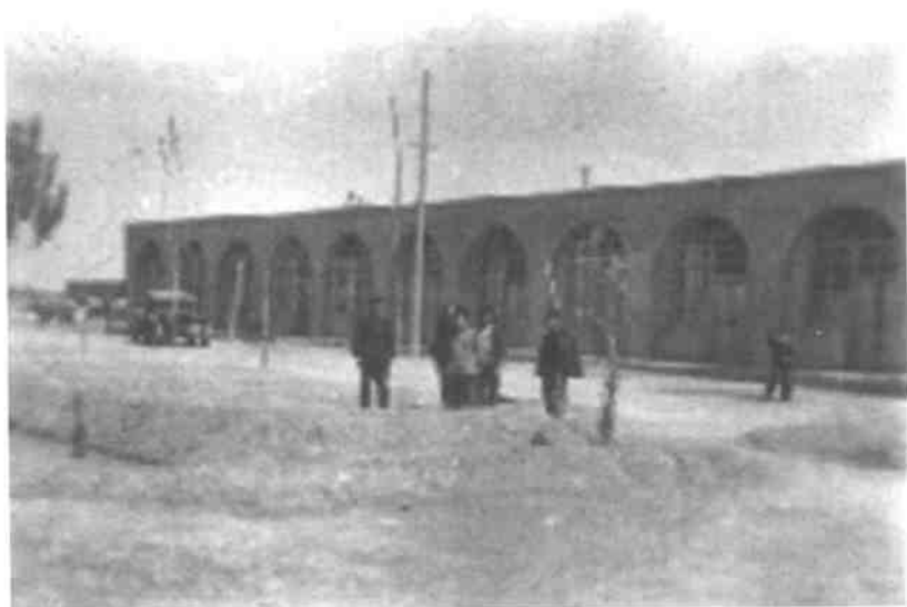
宁夏灵武农场为安置支宁青年修建的住房