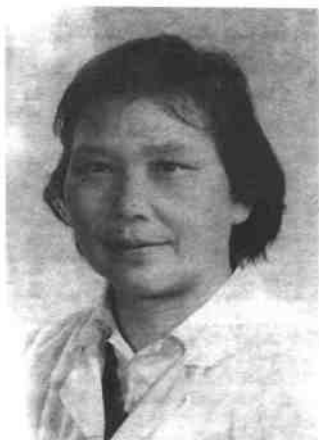
全国“三八”红旗手、“五一”奖章获得者、中共“十四大”代表郭云姣