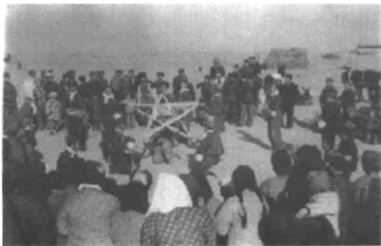
春节期间，宣传队为当地农民演出文艺节目