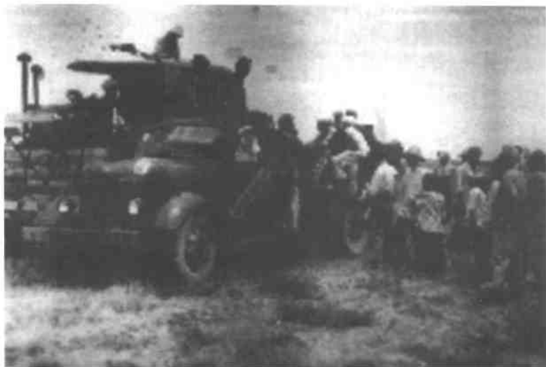
灵武农场联合收割机“康拜因”在自动卸粮