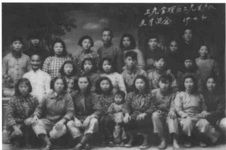
1959年4月，象岗管理区象岗生产队支宁人员留念