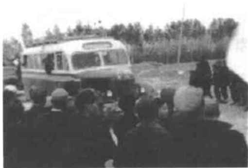
▶ 1959年5月，东阳支宁青年在青铜峡下火车后，乘汽车到农场。途经吴忠时，当地群众夹道欢迎