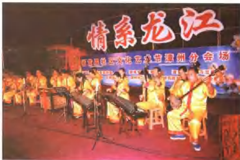
漳州市霞东钩社南词古乐队在演唱南词。