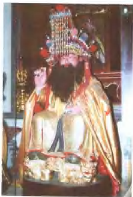
御乐轩所供奉的郎君大仙孟昶雕像。