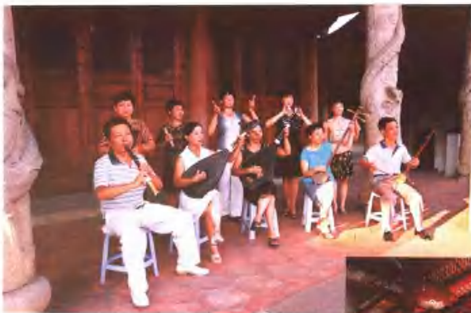
漳州市龙眼营锦歌社在演唱锦歌。该社前身系龙眼营“乐吟亭”。