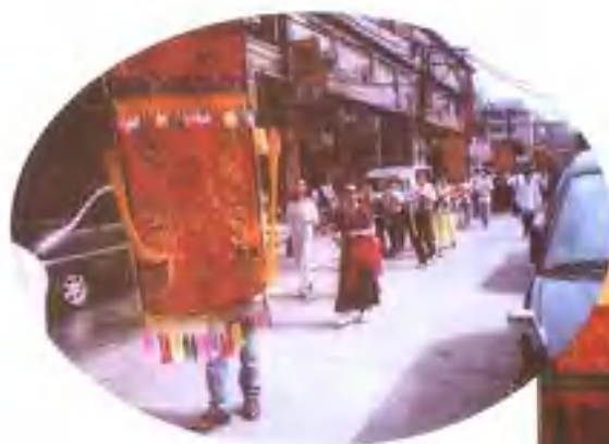
漳州南音代表团应邀出访菲律宾，参加踩街，行进在马尼拉大街上。