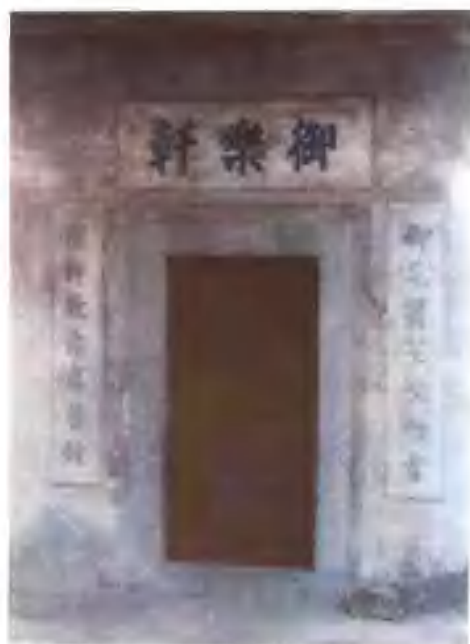
东山县御乐轩南音曲馆旧址，建于清乾隆廿七年（1762）