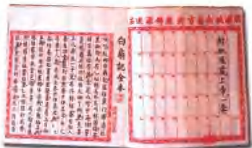
以上图片系著名锦歌艺人林廷先生手抄的锦歌唱本。