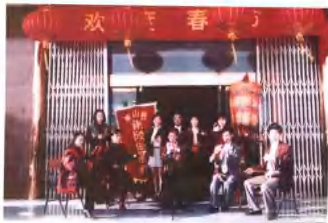
农历二月十二日为郎君大仙孟昶生日。图为郎君弟子庆典场面（部份）