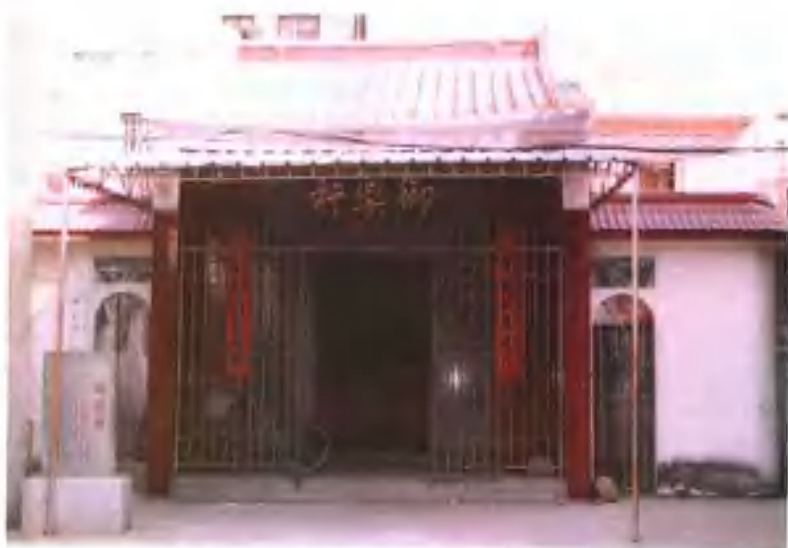
重修的御乐轩新貌。前面所立石碑系县级文物保护单位公告。