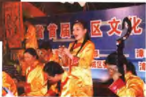
霞东钩社南词新一代茁壮成长。