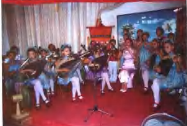
漳州南音新苗新秀茁壮成长。（刘修槐 供稿）