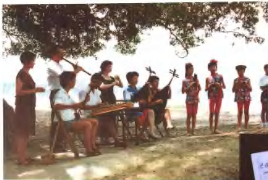
漳州市龙眼营锦歌社参加福建省电视台专题片“八千里路”的拍摄现场。