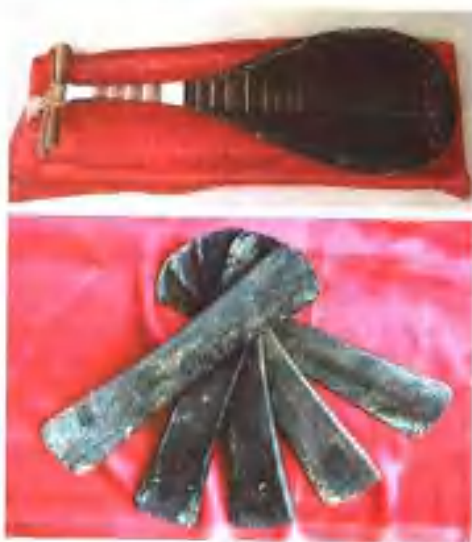
御乐轩所保存的古琵琶和古拍板。