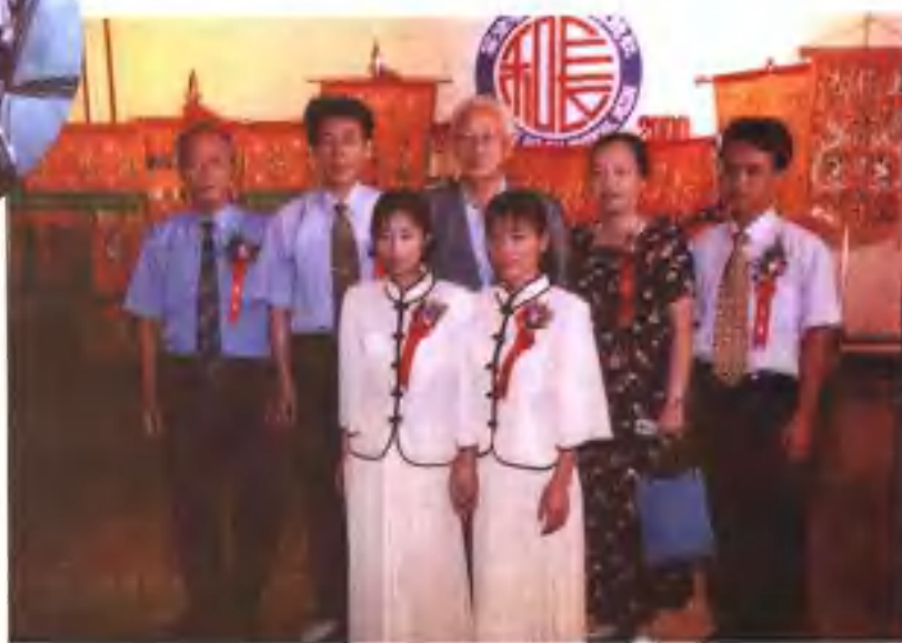
菲律宾内政部长（后排中）会见漳州南音代表团。