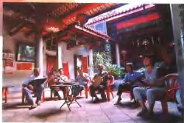
漳州市天宝镇山美锦歌社在演唱锦歌。该社前身系“丰庆堂”第三代歌仔馆。