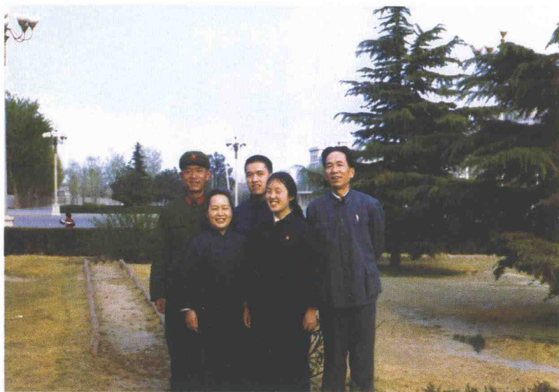
1974年4月全家于北京军事博物馆合影