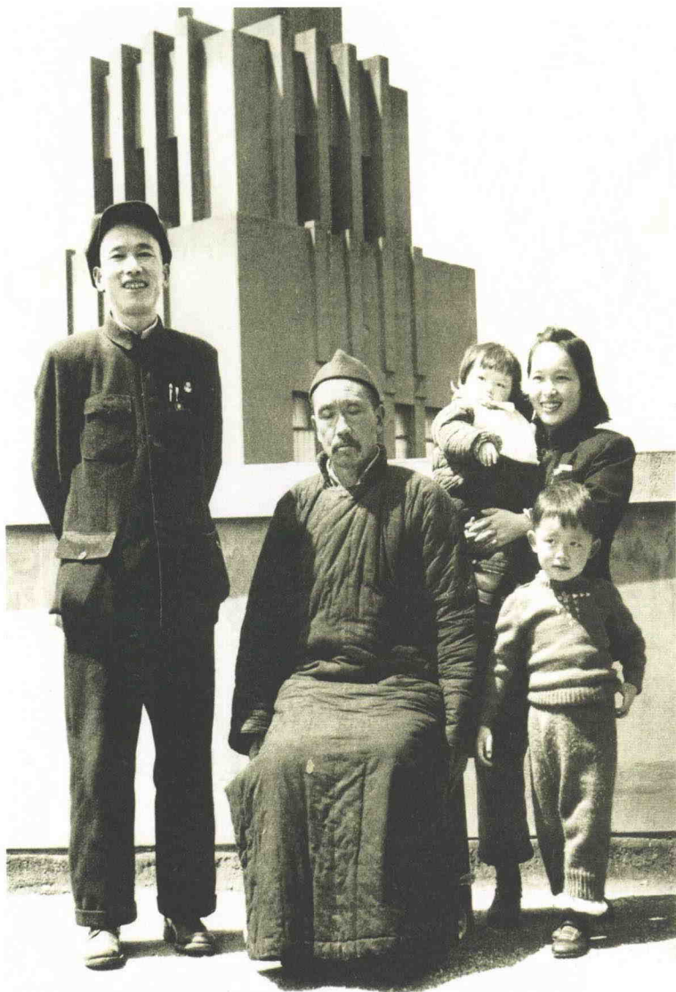
1954 年和父亲、妻子、儿女在汉口