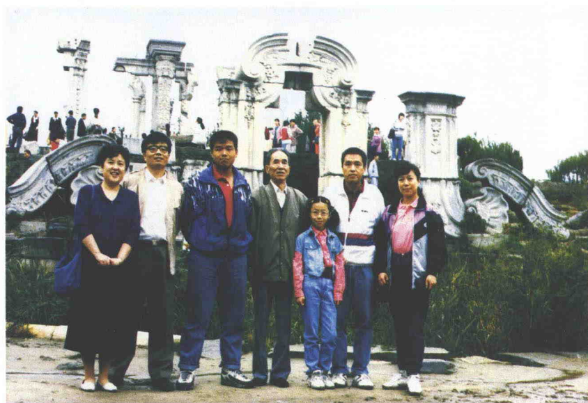
1996年和子孙们在圆明园合影