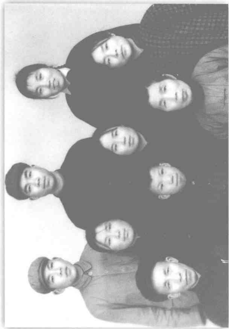
全家福 ( 1976年 )