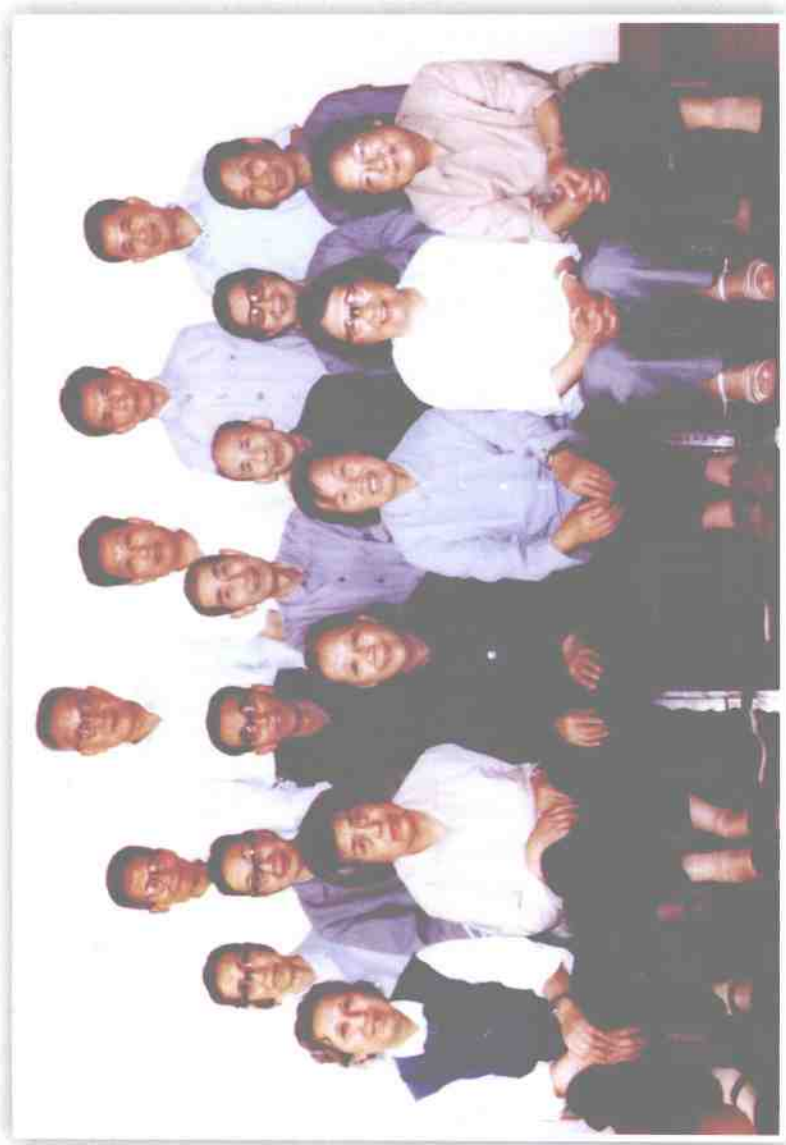
参加中共定海县工委成员座谈会老同志合影（1983年6月于杭州）