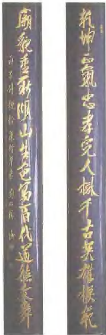
刘正成书 乾坤庙貌联