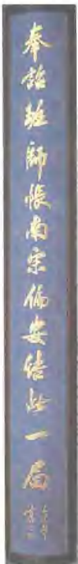
李铎书 奉詔廷師 志联·上联