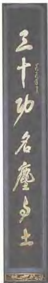
张爱萍书 三十 八千联·上联