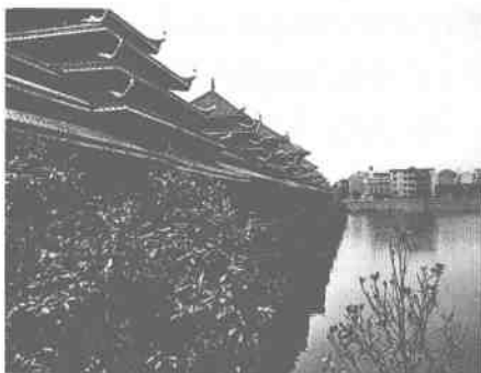
侗族独有的风雨桥