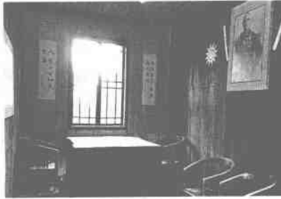
当时的中国陆军总司令何应钦的办公室