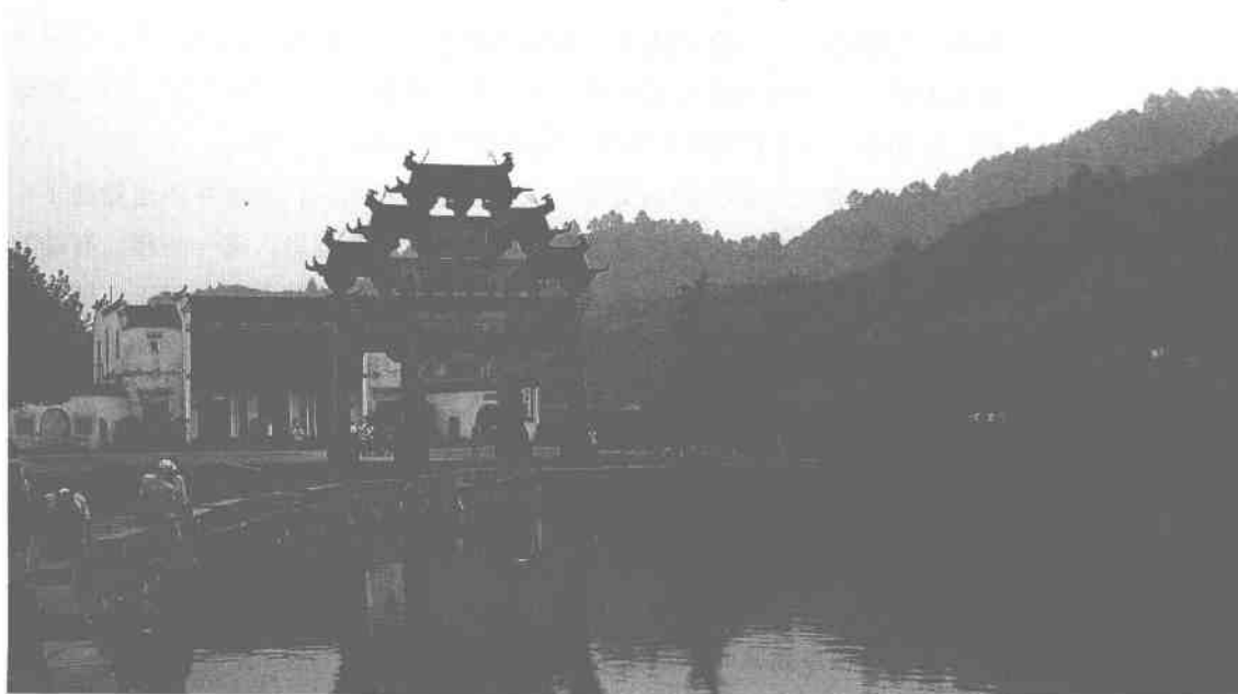
西递村头 2005年8月30日摄

这些鳞次栉比的古民居，或造型别致，或用料考究，或装饰高雅，各具特色，奇巧夺目，在形象显示主人雄厚财力和显赫身份的同时，也彰显着