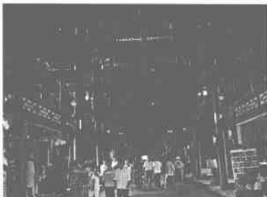
风雨桥桥面两边的商铺