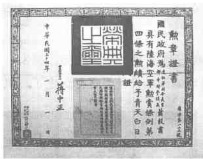
蒋介石给萧毅肃授勋章证书

芷江县不大，却有侗、汉、苗、蒙、回、布衣、土家、黎等15个民族，其中侗族占48.4%，因而历代遗存的侗族古建筑不少。位于溇水河上的龙津风雨桥，就是国内少有的具有浓郁侗族特点的桥梁。