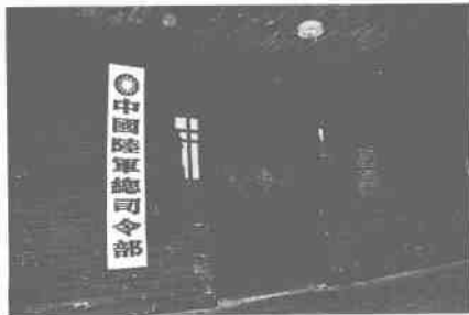
受降时芷江设立的中国陆军总司令部