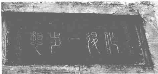
“作退一步想”门额 2005年8月30日摄