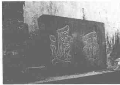
西递村现存最早的一块村名碑，被一村民收藏 2005年8月30日摄