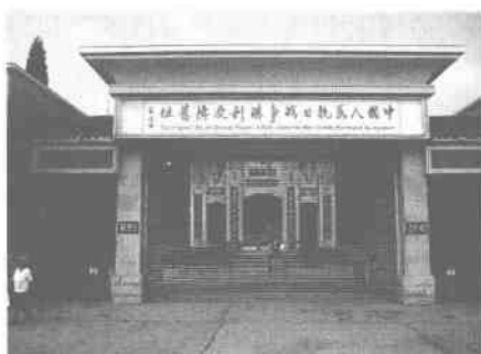
中国人民抗日战争胜利受降旧址正门