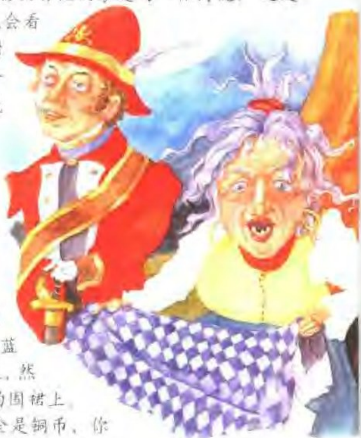
巫婆把自己的蓝格子围裙交给士兵，让他到树洞里去取打火匣。

“你这个好家伙！”士兵说着就把狗抱到巫婆的围裙上。然后他拿了满满一口袋铜币。他把箱子锁好，把狗又放到上面。接着，他打