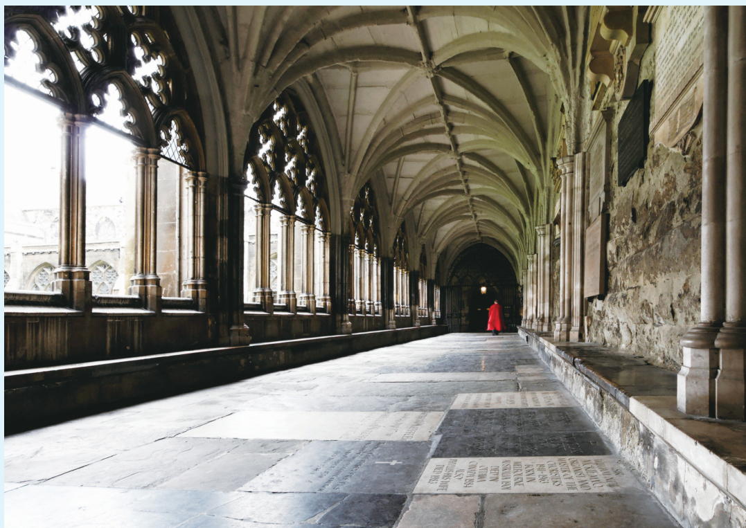
▶ 威斯敏斯特教堂走廊