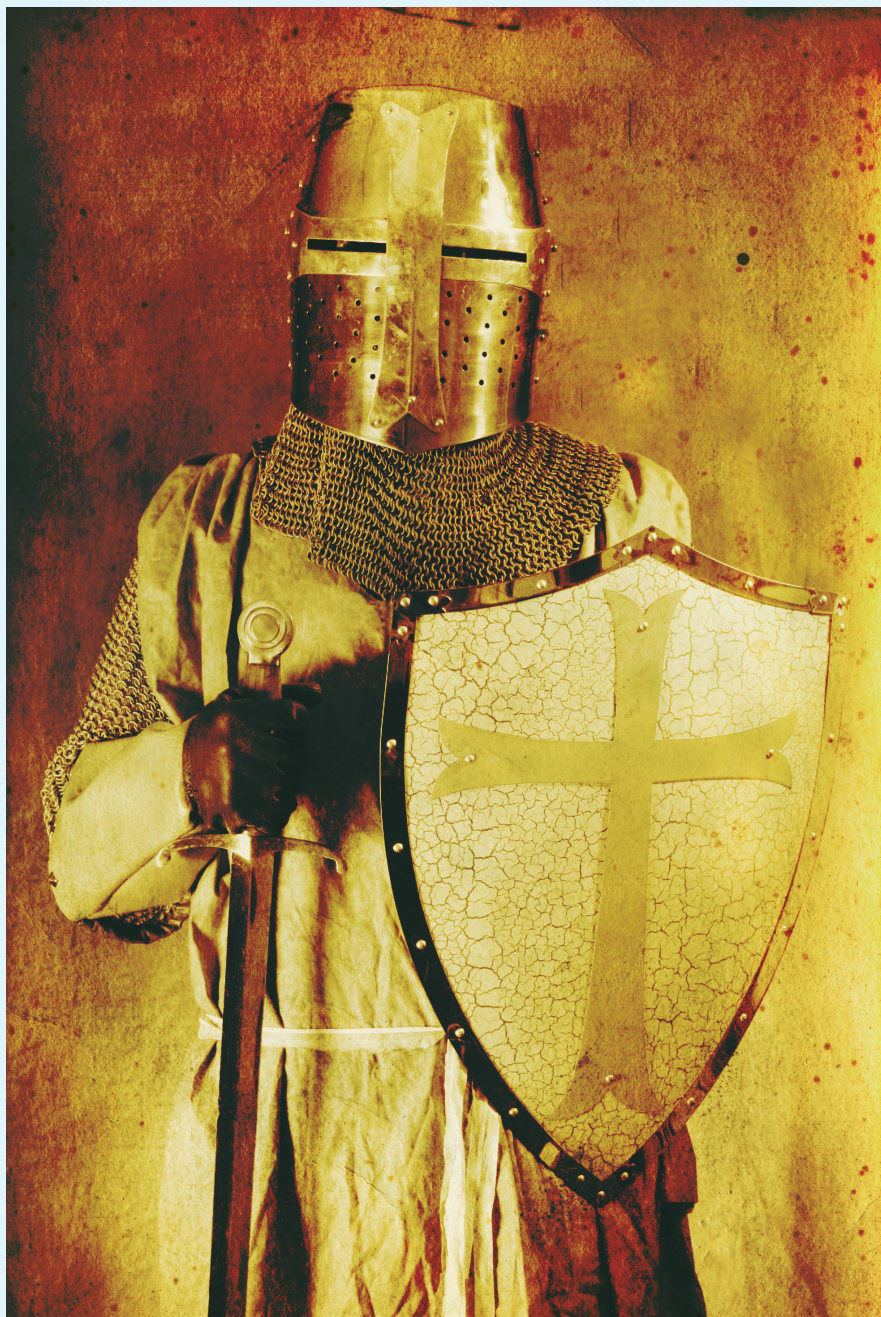
▲ 历史上的十字军骑士装扮