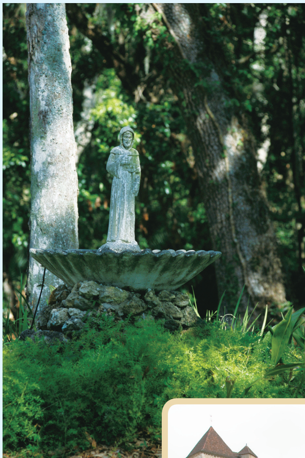
◀ 英国公园风光一角