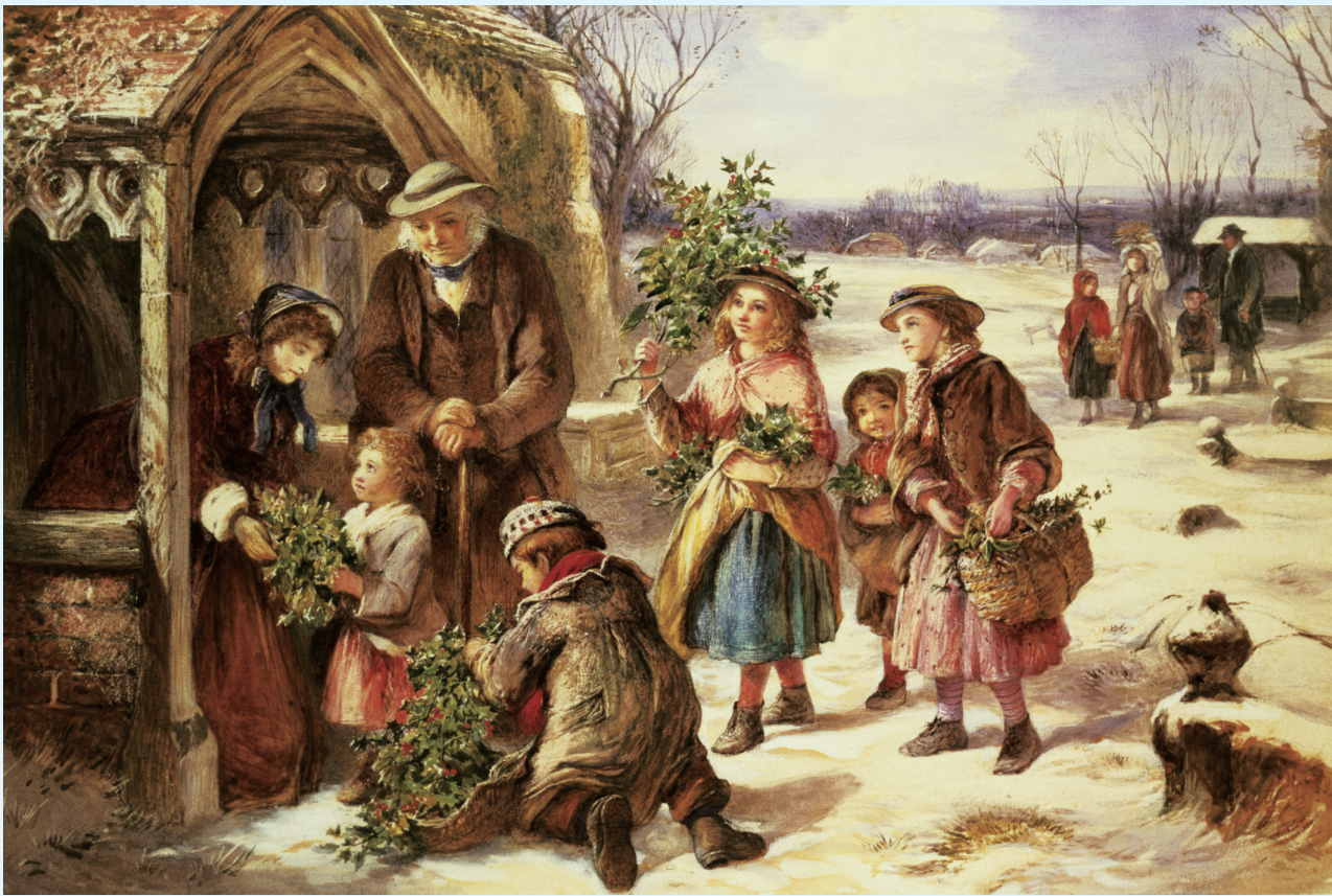
▲ 油画《圣诞节的清晨》