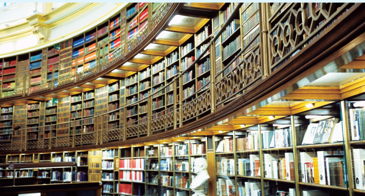
▲ 大英博物馆藏书馆