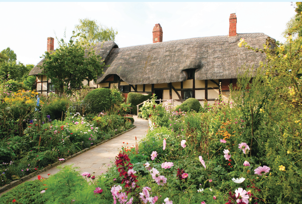
▲ 英格兰沃里克郡莎士比亚故乡（Stratford-upon-Avon镇）安妮庄园