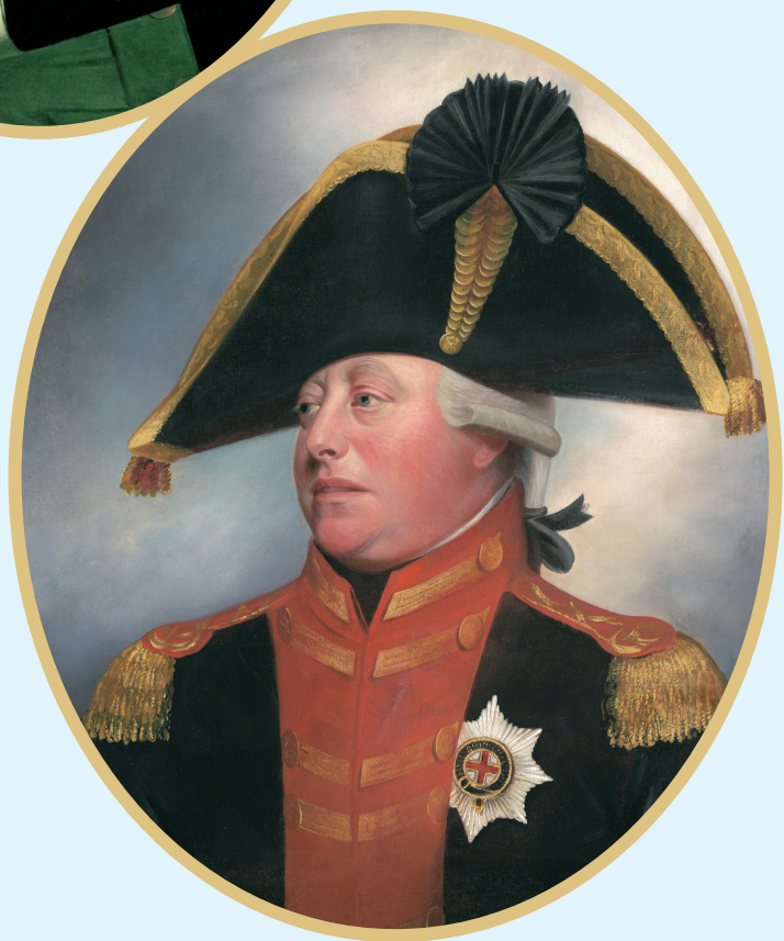
▲ 肖像画《华盛顿将军》