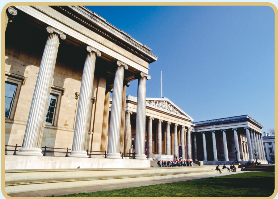
▲ 大英博物馆，又名不列颠博物馆，位于英国伦敦新牛津大街，成立于1753年，是世界上历史最悠久、规模最宏伟的综合性博物馆之一。