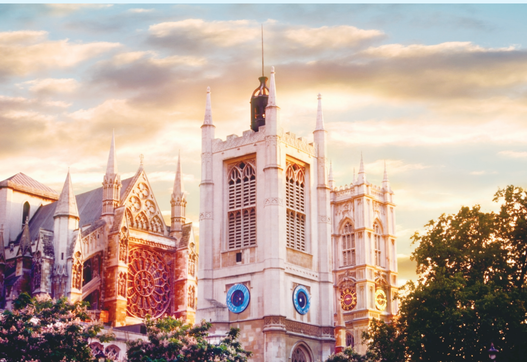
▲ 威斯敏斯特大教堂坐落在伦敦泰晤士河北岸，始建于公元960年，1540年后，一直是伦敦的国家级圣公会教堂。