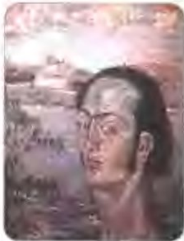
达利年轻时的自画像