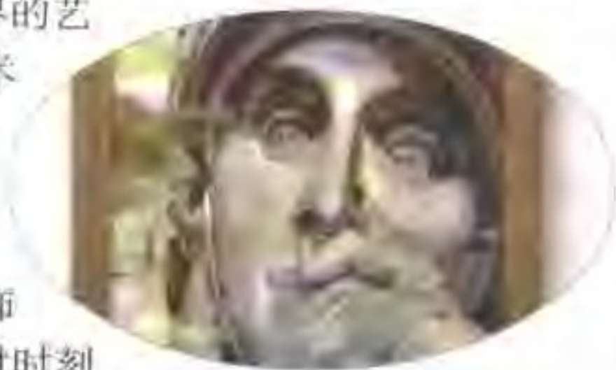
达利1983年的一幅作品

达利终生热爱他儿时的风景，家乡的古老风景以令人悲伤的情绪始终存在于他的画中。他的性格中潜藏着怪异，而他认为这种精神状态与西班牙是一致的。在许多西班牙艺术家身上，渗透着一种夸张与过度兴奋的感