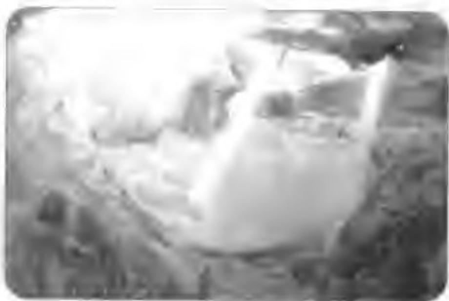
——幅天顶画的草图，是达利与卡拉一起升天的景象，周围的风景则代表着西班牙重要的市景

很显然一定有其他世界存在，这一点我可以肯定。正如我以前多次所说，一定有其他世界存在于我们的世界里，刚好处于达利博物馆的正中，正是在这里，有