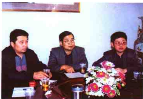
在河南省党报社会周刊年会上