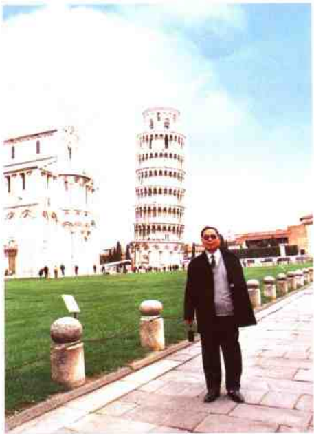
参观意大利比萨斜塔