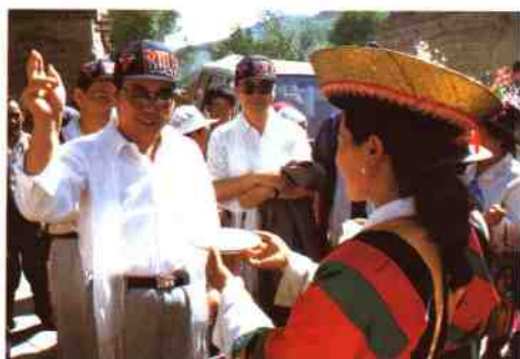
到青海日报社考察学习，感受 土族农家风情