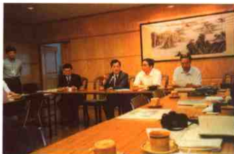
访问香港文汇报社