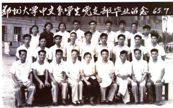
郑州大学中文系学生党支部毕业留影。第二排左起第三人为作者