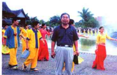
在西双版纳参加泼水节