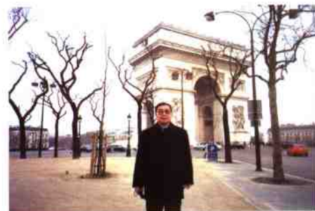
访问法国在凯旋门前