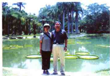
与夫人在西双版纳热带植物园