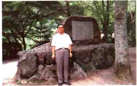
访问日本在周恩来诗碑前