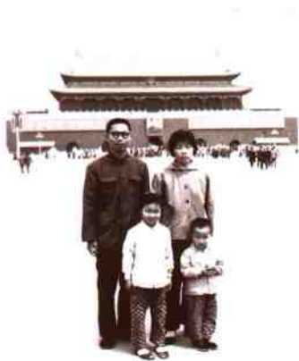
在北京大学进修期间，与夫人和孩子在天安门广场