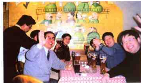
在德国参加啤酒节