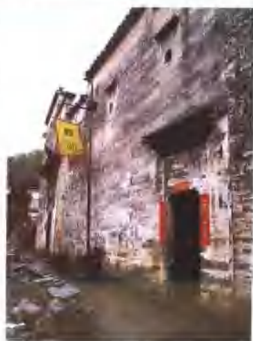
在高楼下的小巷，有的只能容下一个人，偶遇两人相碰，那必双双作侧身，相互避让。

中，在丹青水墨般的春天和油画般璀璨华丽的金秋，一山一水，一事一物，无不展露她自在、清幽、静美的姿色。错落错落的村落，鳞次栉比，层楼叠院，精雕细镂而又与自然和谐相成，相得益彰。岁月的沉淀，注入了这方山川以古风雅韵。