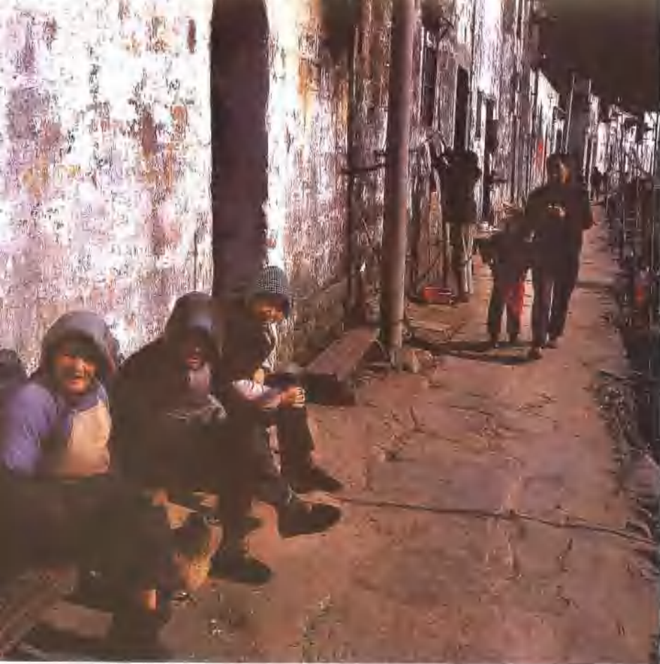
走进古村，走进了历史。

中，在丹青水墨般的春天和油画般璀璨华丽的金秋，一山一水，一事一物，无不展露她自在、清幽、静美的姿色。错落错落的村落，鳞次栉比，层楼叠院，精雕细镂而又与自然和谐相成，相得益彰。岁月的沉淀，注入了这方山川以古风雅韵。