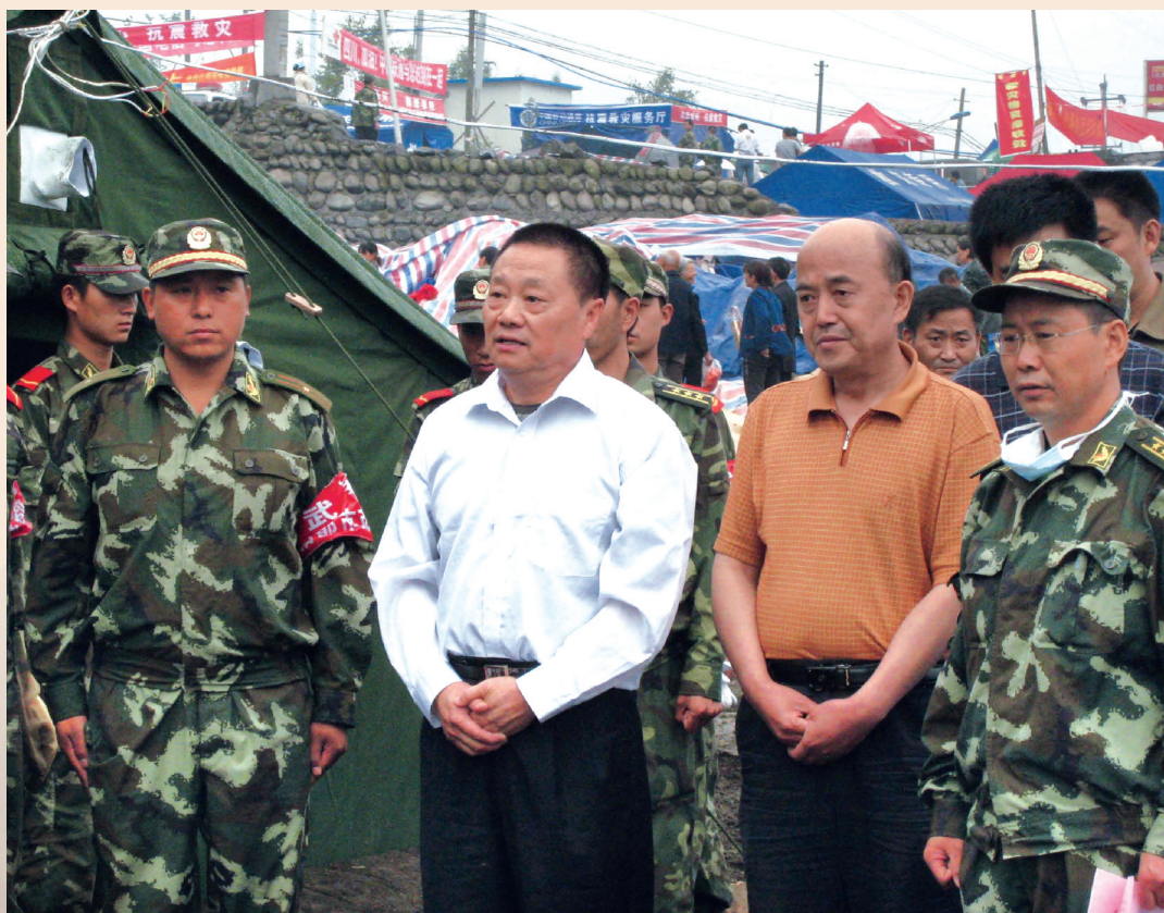
▲ 省人大常委会副主任王宇坤在地震灾区视察