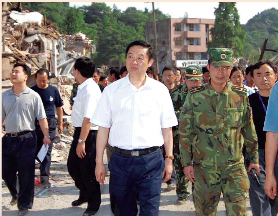
▲ 四川省省委书记、省人大常委会主任刘奇葆在抗震救灾第一线