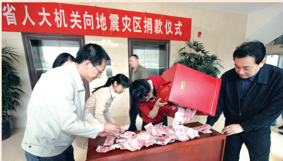
▲ 省人大机关全体干部职工向地震灾区捐款