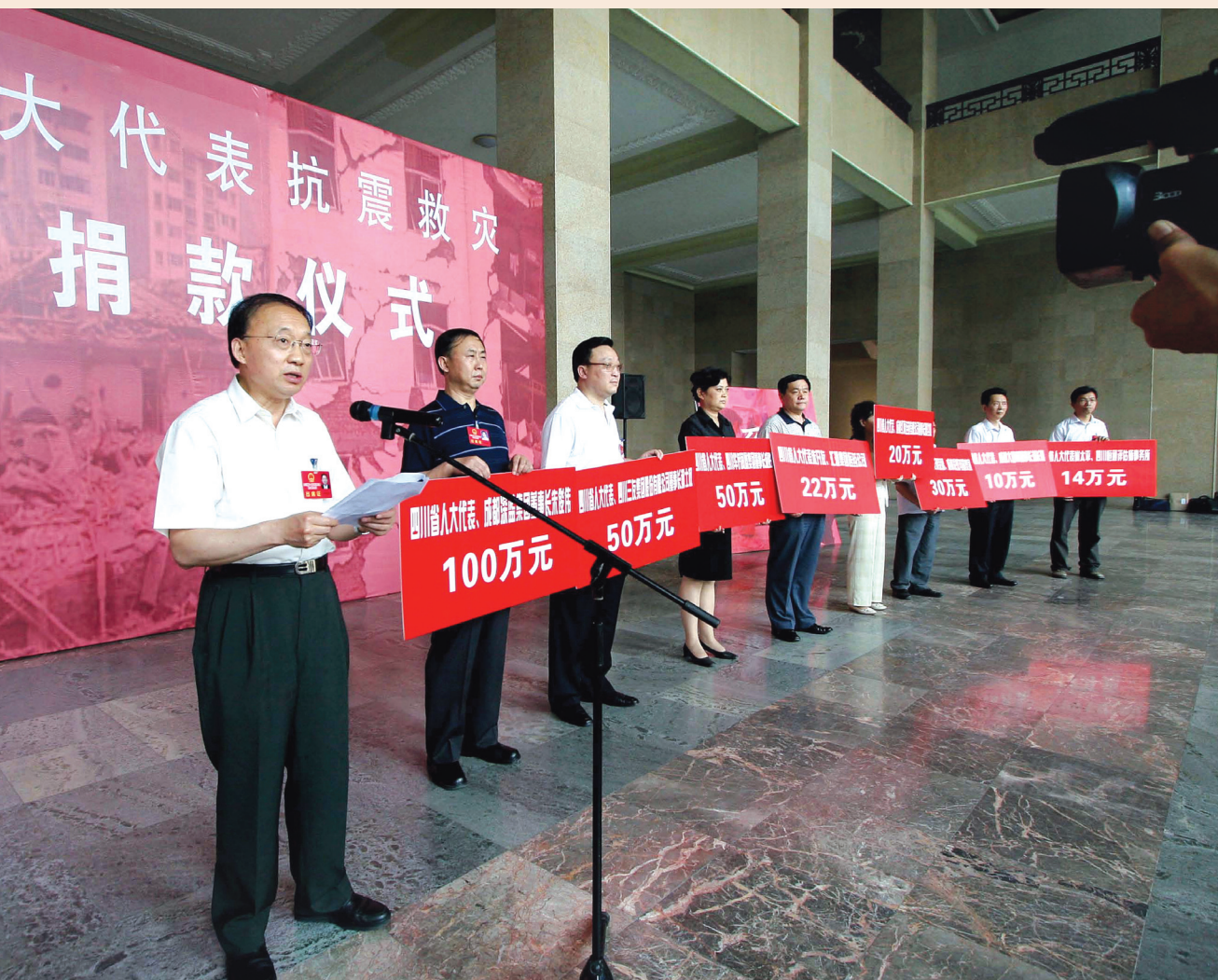
▲ 省人大代表向地震灾区捐款