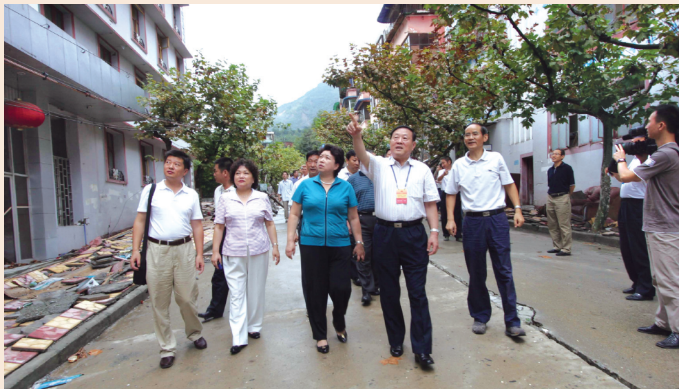
▲ 全国人大代表在北川调研