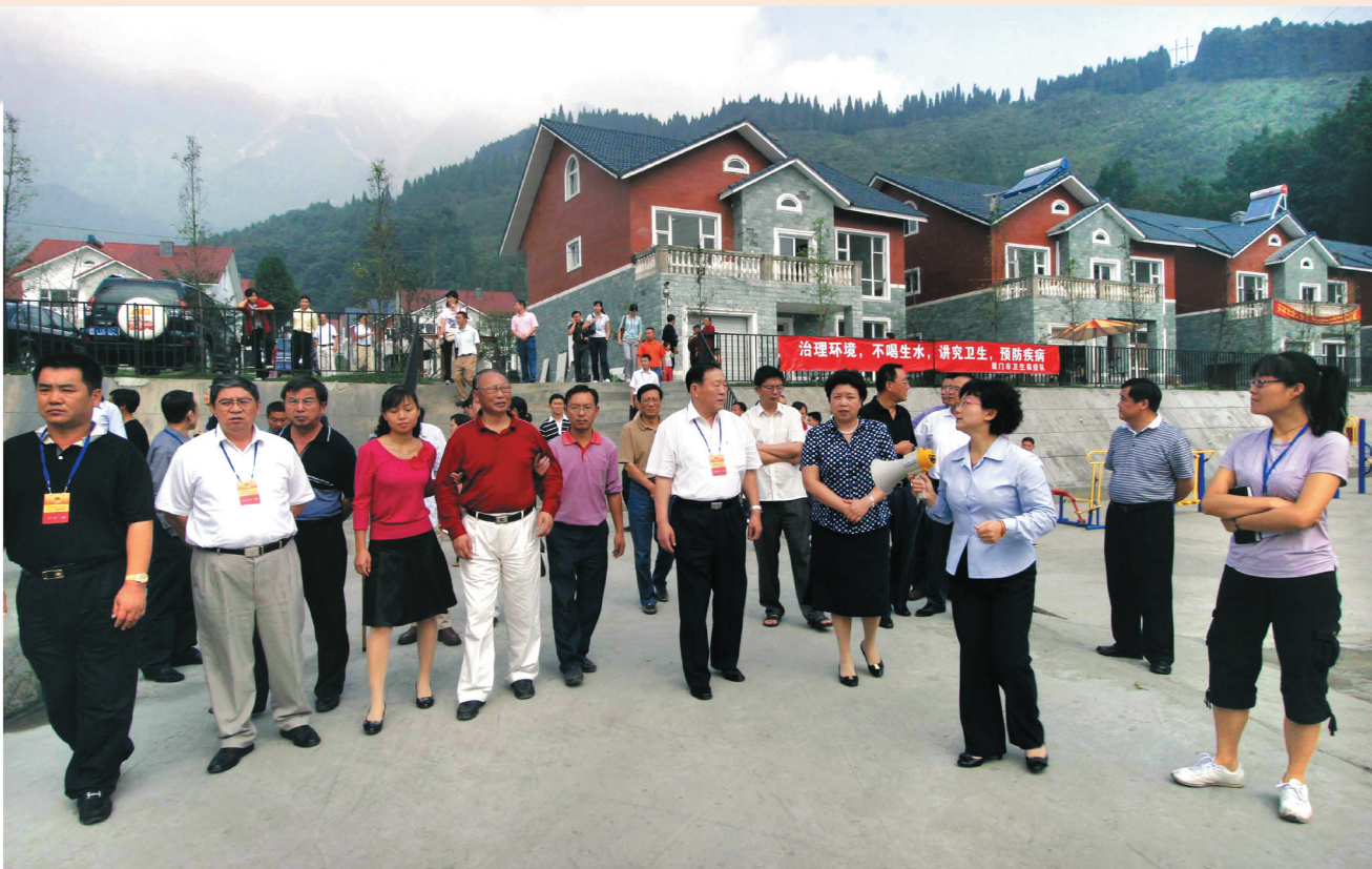
▲ 全国人大代表在宝山村调研