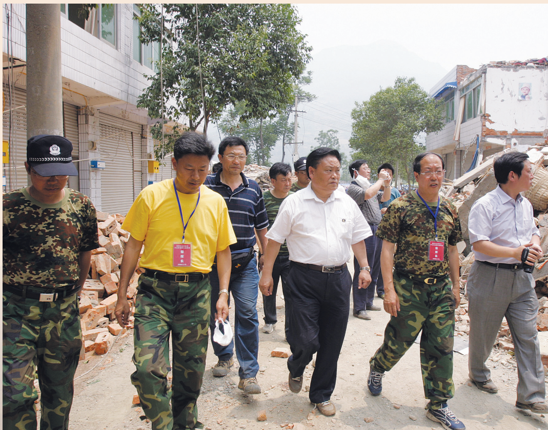
▲ 省人大常委会副主任韩忠信在平武县南坝镇重灾区指导工作