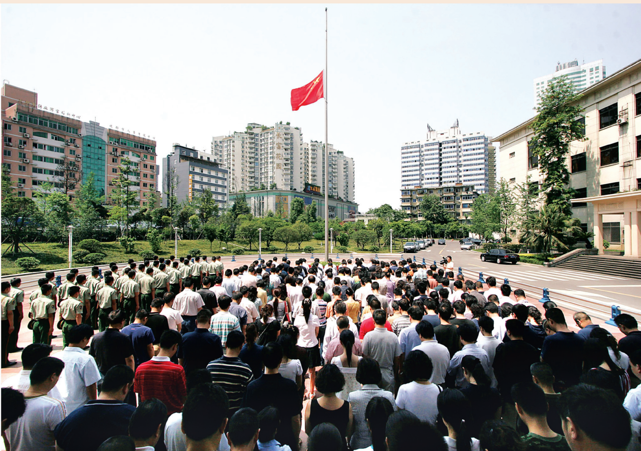
▲ 市人大常委会机关干部、职工为地震遇难同胞降半旗默哀