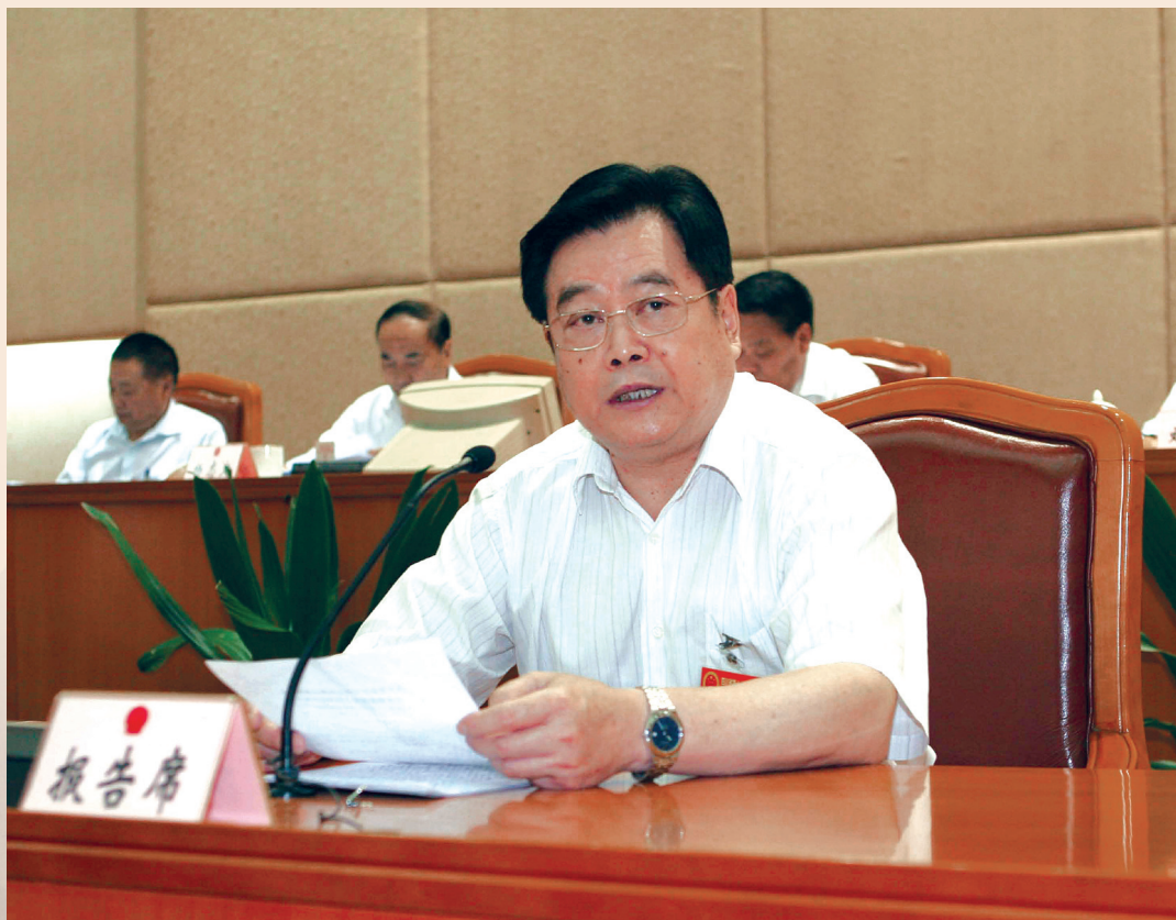
▲ 2008年7月21日，四川省人民政府省长蒋巨峰向省十一届人大常委会第四次会议报告全省抗震救灾工作