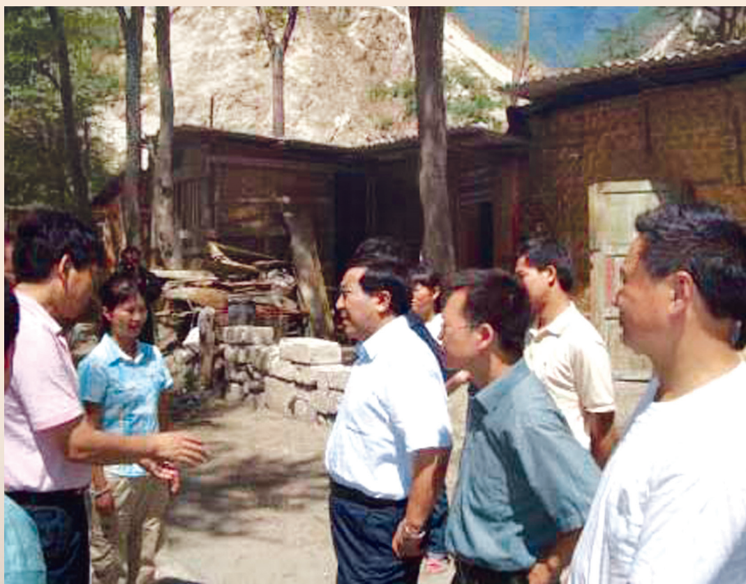
▲ 省人大常委会副主任张东升在汶川看望地震灾区群众