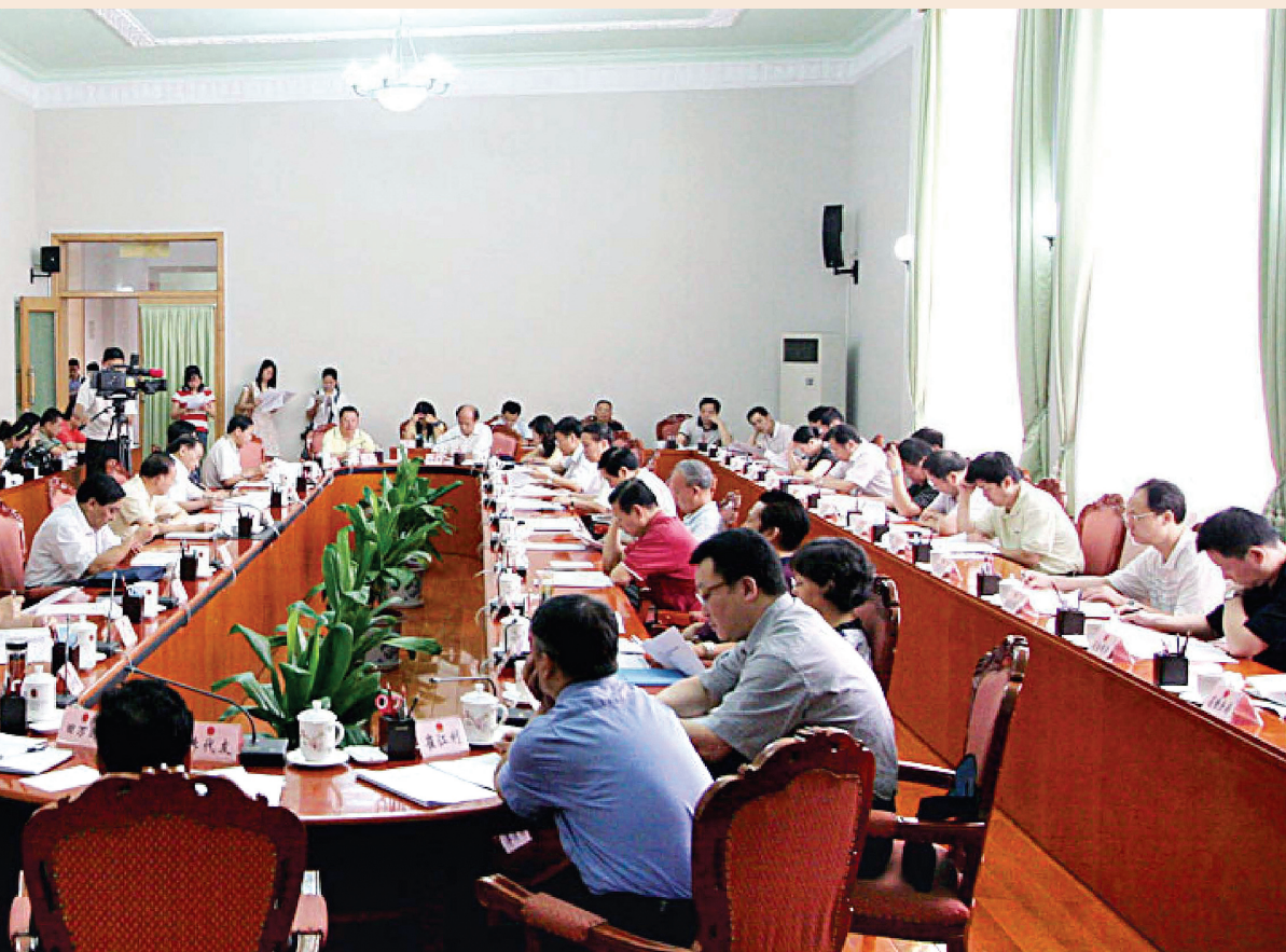
▲ 省人大常委会迅速组成执法检查组对地震灾区进行价格执法检查，确保灾区价格稳定