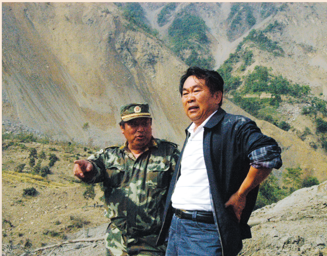
▲ 省人大常委会副主任郭永祥在唐家山堰塞湖现场指导应急处置工作