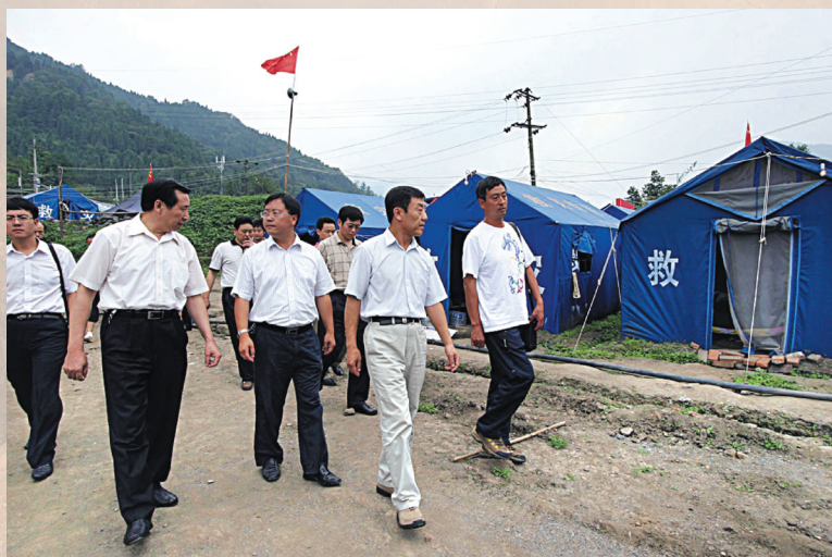
◀ 全国人大财经委在重灾区红白镇调研