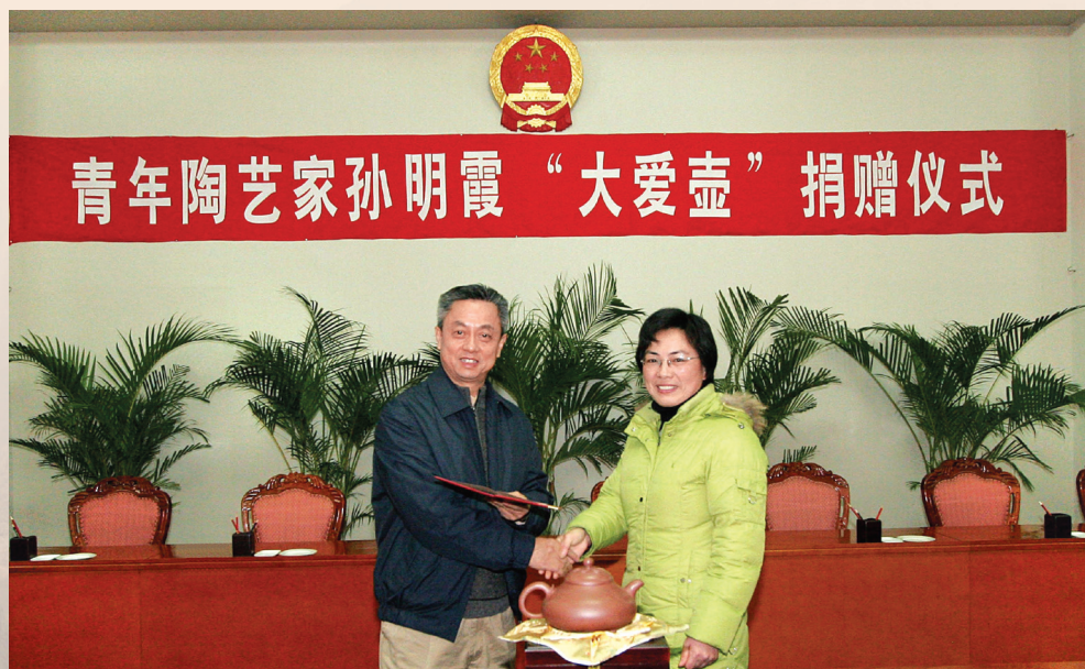
▲ 艺术家向地震灾区献爱心