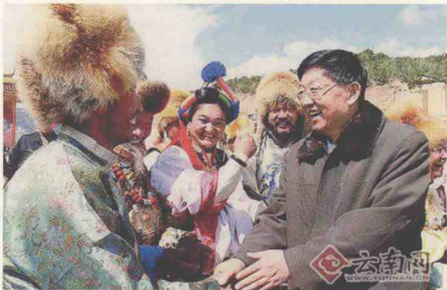
白恩培在德钦县奔子栏镇奔子栏村看望藏族群众。

这是一片美丽的土地：独具魅力的雪山、森林和峡谷，绿水青山、蓝天白云吸引着世界的眼球；这是一片发展的热土：37万各族群众在这里辛勤劳动、和谐共处，古老的雪域高原焕发出无限的生机和活力。这就是云南省唯一的藏族自治州——迪庆。