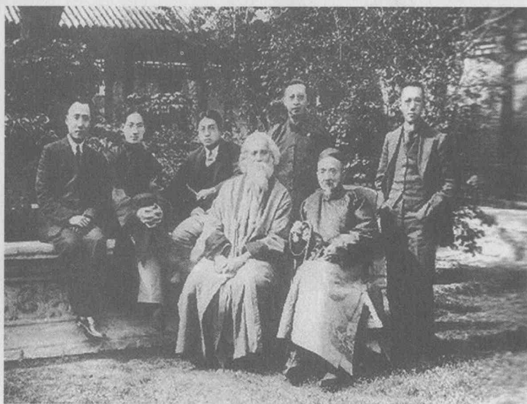
1924年泰戈尔访华时摄于北京