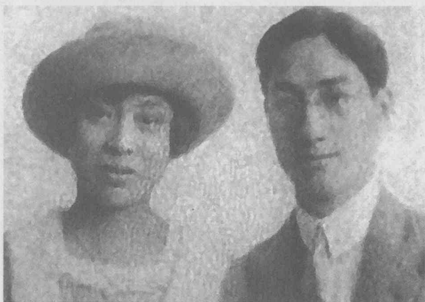
1924年徐志摩与原配夫人张幼仪于欧洲