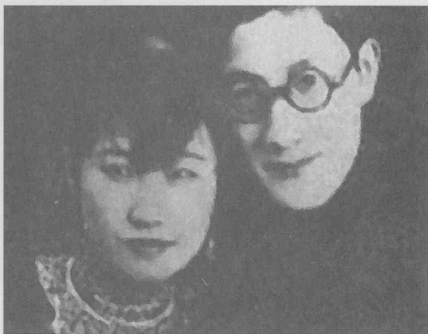
徐志摩与陆小曼婚后合影