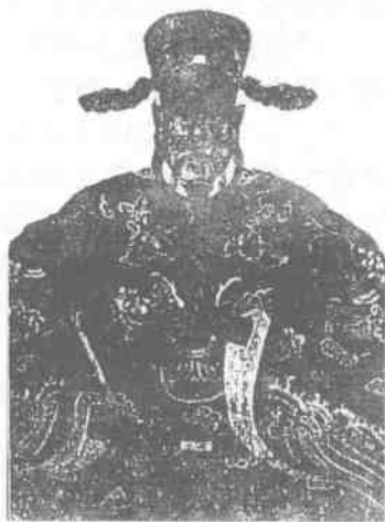
◀ 像 遺 公 丘 湄 邢 ▶