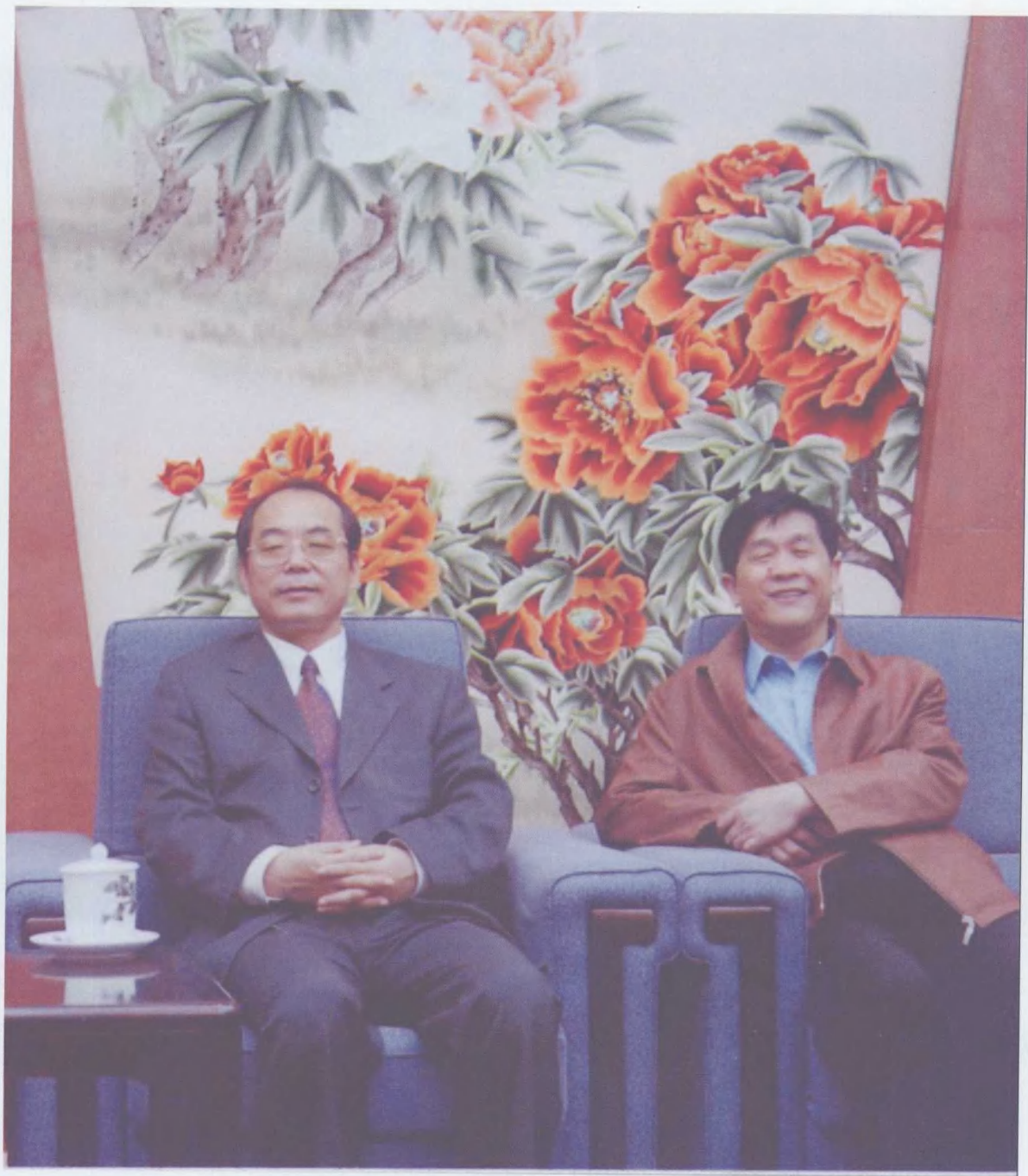
2004年5月12日,作者在北京人民大会堂采访中共湖南省委常委、省纪委书记许云昭(时任湖南省政府副省长)