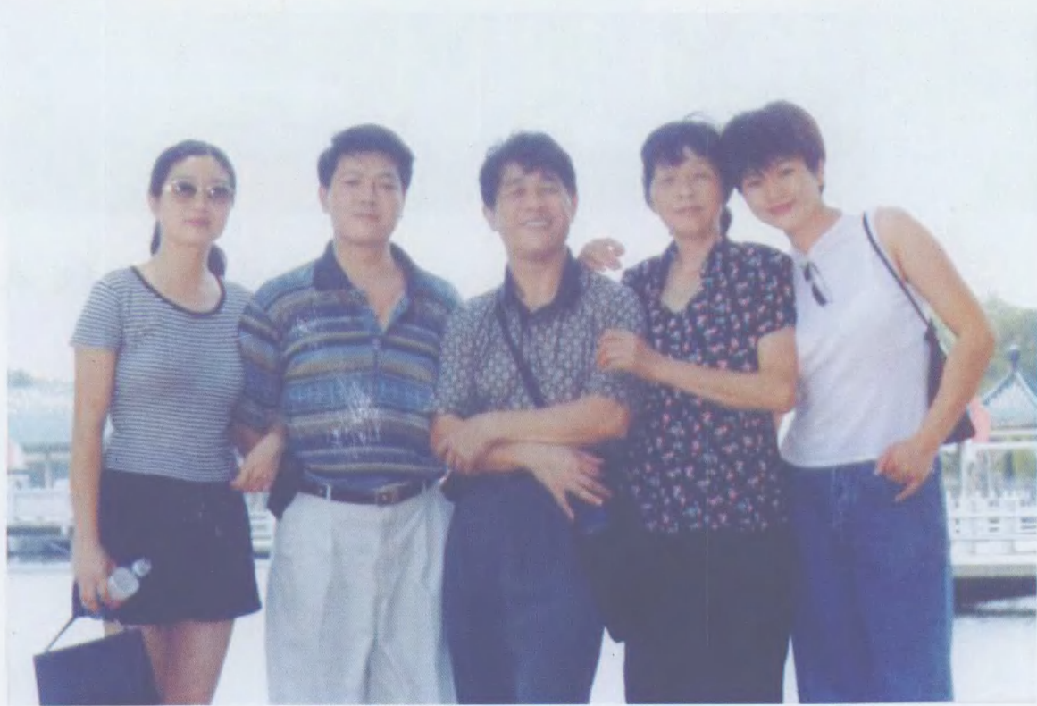
作者夫妻与子女在一起