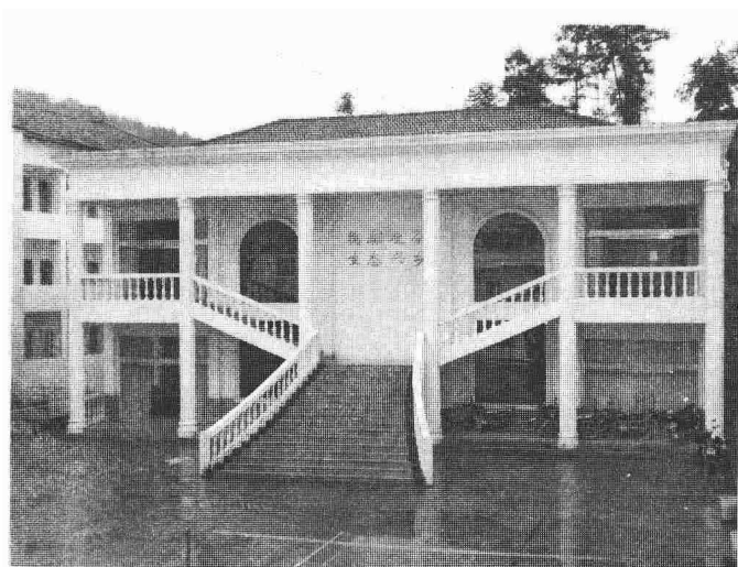
“稳麻攻茶，生态兴乡”——写在下堡坪乡政府办公楼墙上的经济发展思路

三阳。从地图上看，下堡坪乡的地理空间呈椭圆形状，地势由西北向东南逐渐降低，海拔高度悬殊，如乡境北部双龙山的海拔为1502米，而位于西北娄子山村的笔架山的海拔有1341.1米，到了西南的板仓河河谷海拔在400米以下，高低相差约1100米。其间形成了小盆地、高山小平原以及凹凸不平的各种山地丘陵地貌。乡境内从东到西宽约19公里，从南到北长约23公里。全乡现有总面积252平方公里，耕地面积2288公顷（其中水田是1090公顷，旱田为1198公顷），乡境内的有效灌溉面积为998公顷，旱涝保收面积是880公顷，25度以上斜坡的坡耕地有679公顷。全乡现辖谭家坪村、秀水坪村、赵勉河村、楼子山村、中柳坪村、白鹤寺村、十八湾村、磨坪村、锅厂村、蛟龙寺村、烟灯垭村、天府庙村、泉湾村、九山坪村、