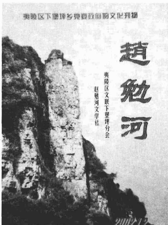
下堡坪乡自办的内部文化刊物《赵勉河》文学杂志

或许是由于名声在外的缘故，有关下堡坪的文字资料不少，有公开出版的，有音像的，也有内部打印的。乡里还办了一个叫《赵勉河》的杂志，这是一份反映地方文化的内部刊物，每年不定期地出一至二期，刊登的内容有小说、散文、诗歌、民间故事传说、舞台戏剧、校园师生的文字作品以及美术和书法等等。