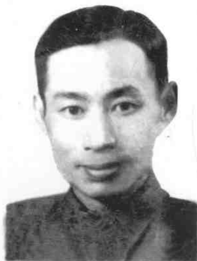
作者摄于一九四三年，左为作者手迹

老華早歲著滄湘晚著點 靈作故鄉石證三生留昨 夢花看別苑話重陽江 山艾葉菴前迤迤翰公規 擬賦唐甲秀水明芳杜 碧一觴一詠任徜徉 壽順景 七 大光 壬戌 初夏