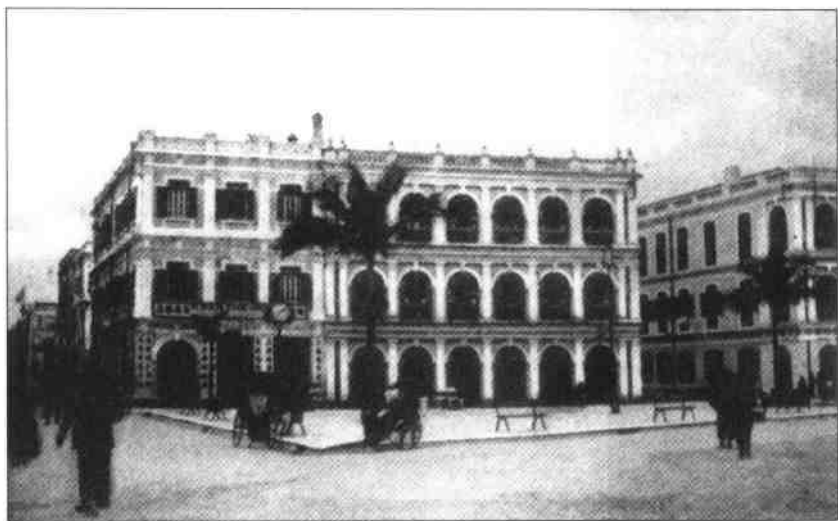
议事厅前地左侧的建筑物(约 1920 年)

议事厅前地是澳门每天游人最多的地方,它像北京的王府井,又像巴黎的香榭丽舍,地方虽小,却是人流纵横,人山人海。磁铁一样强大的引力把我们吸进一圈圈一层层涌动的漩涡。那人流又如一条往返舞动的彩色斑斓的巨龙,而那些“舞手”不仅是澳门人,更是来自祖国大陆、台湾、香港和世界五大洲的游客。澳门民政署正在向人们派发纪念澳门“申遗”成功的特制“世遗明信片”,明信片上用中、葡、英三种文字写着:“澳门世界遗产/Macau Património Mundial/Macao World Heritage”和“让我们一起欢呼澳门历史城区列入世界文化遗产!”明信片上还印着于1860年建成的中国第一个西式剧院岗顶剧院的图案。“世遗明信片”无疑是一个重要纪念,也是一个颇具价值的历史见证,纪念和见证澳门社会发展史上一个重要时刻!