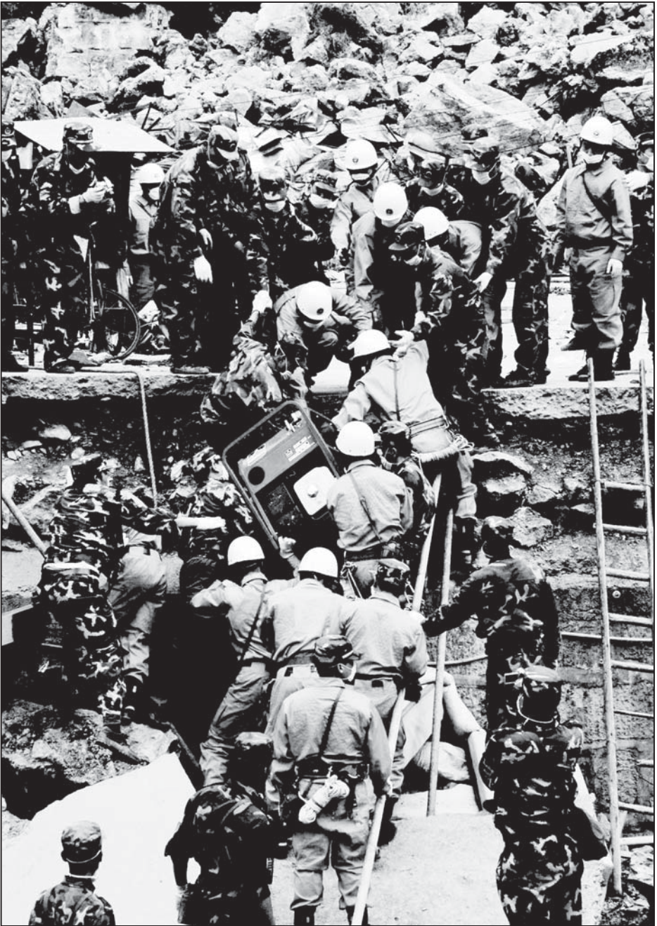
向前，向前！挺进，挺进！救援部队的官兵们昼夜兼程，全力抢险，在地震灾区的残垣断壁间运送装备。