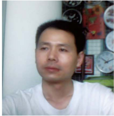
墨雪詩歌主編 風之點