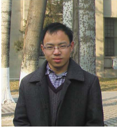
墨雪站長 七月友小虎