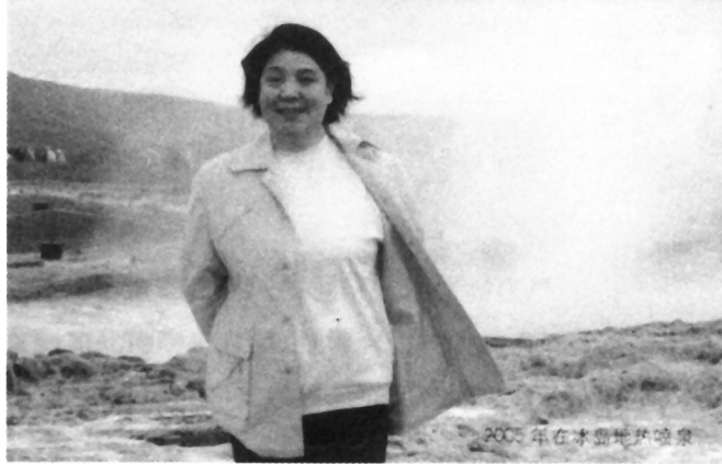
2005年在冰岛地坑喷泉