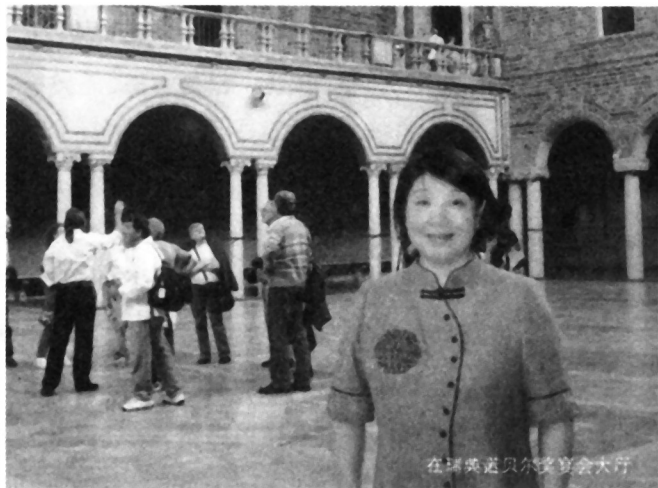
在瑞典诺贝尔宴会大厅