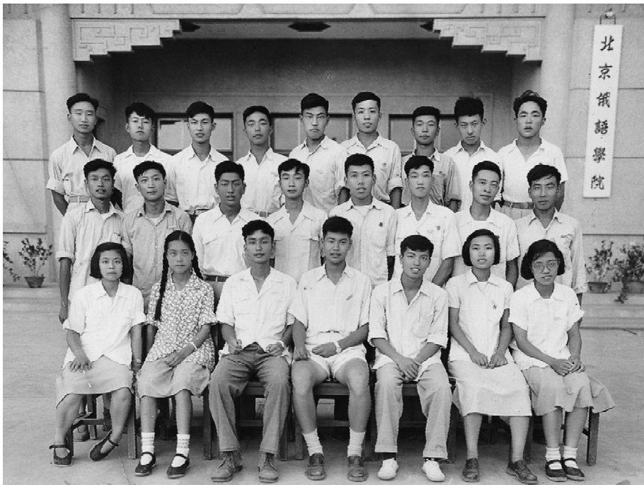
留苏预备部五班同学合影。第二排左三为作者（1955年7月）。

但在高教部宣布专业分配时，却让我到莫斯科国际关系学院学习外交，具体专业为中南美洲。我当时不知道外交为何物，一点常识都没有，但只有一个