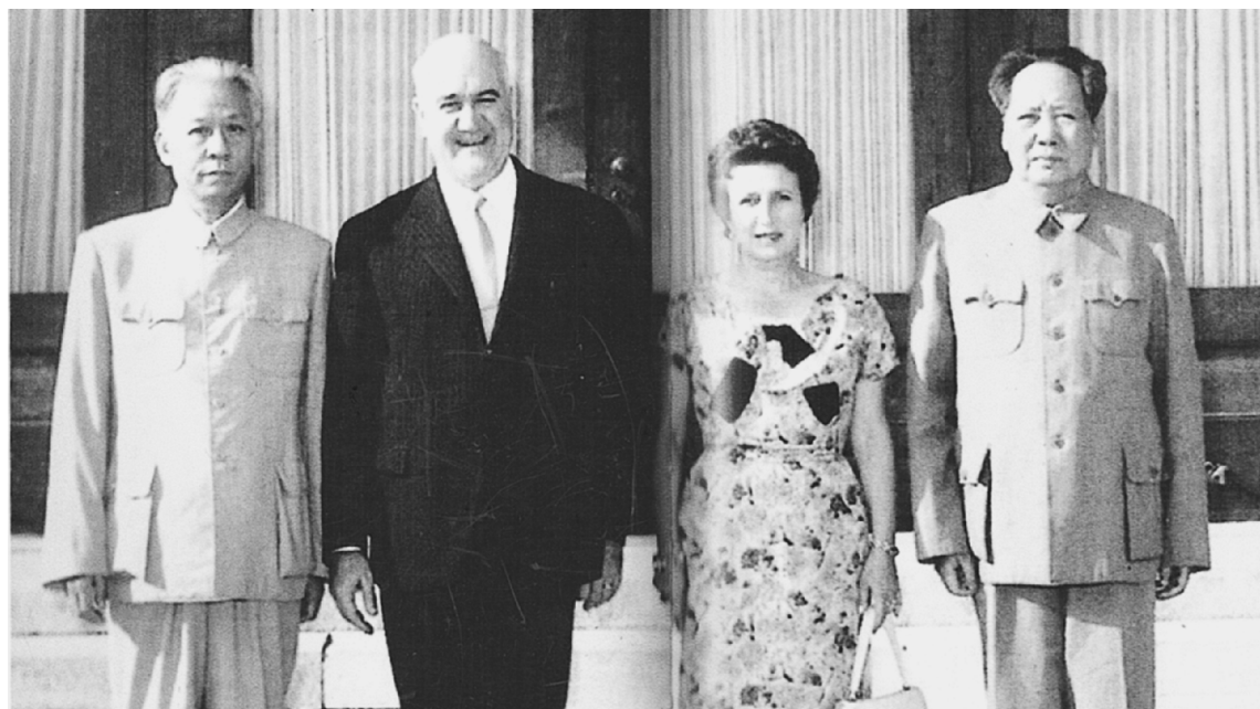
上图：1961年8月，毛泽东主席在杭州会见来访的巴西副总统古拉特。