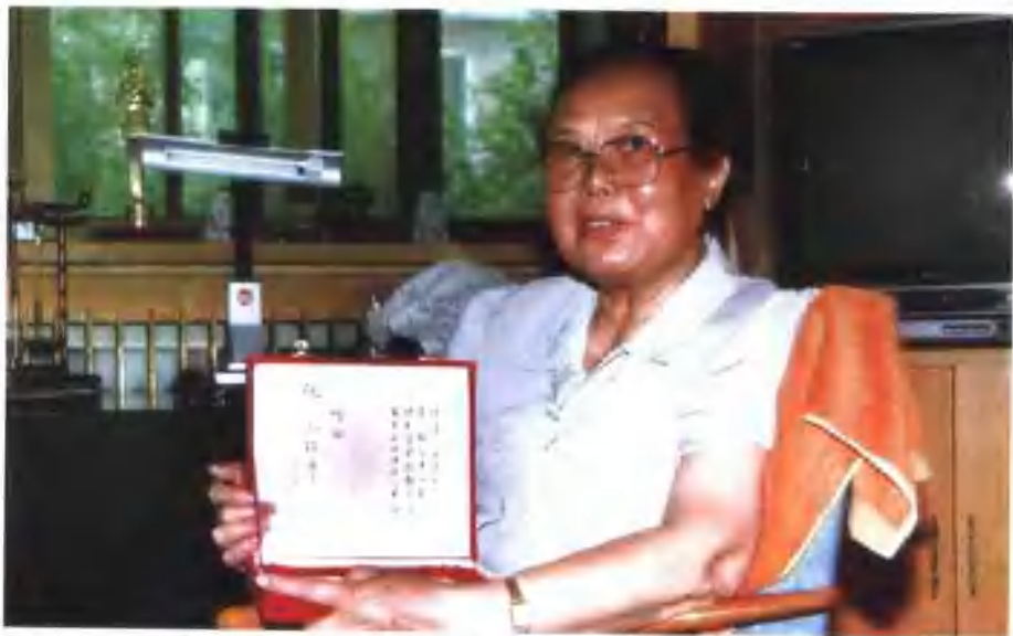
全国少年儿童基金会赠予的奖牌