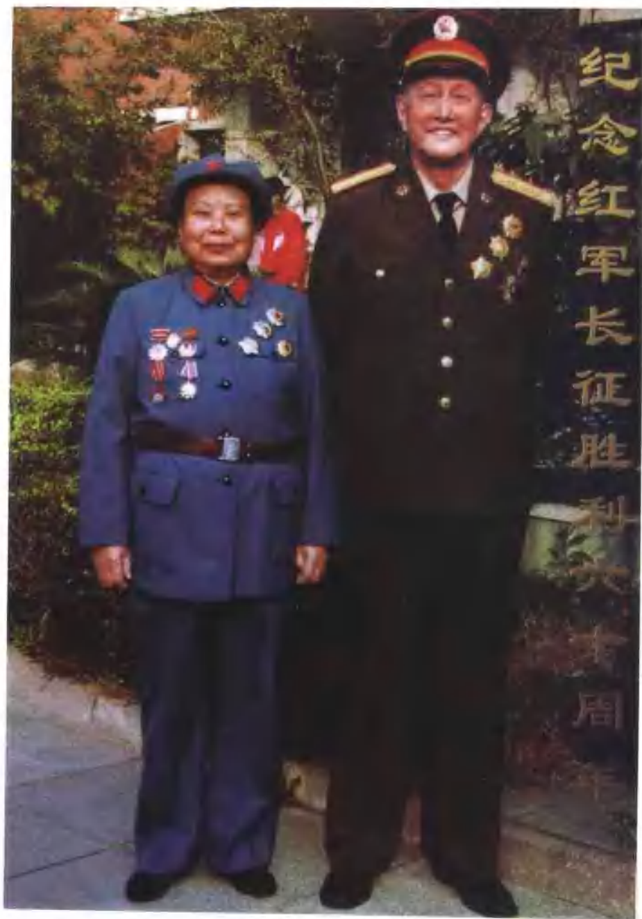
1996年为纪念红军长征胜利60周年与丈夫洪学智合影