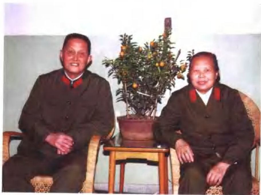
1978年与恢复工作后的丈夫洪学智在家中