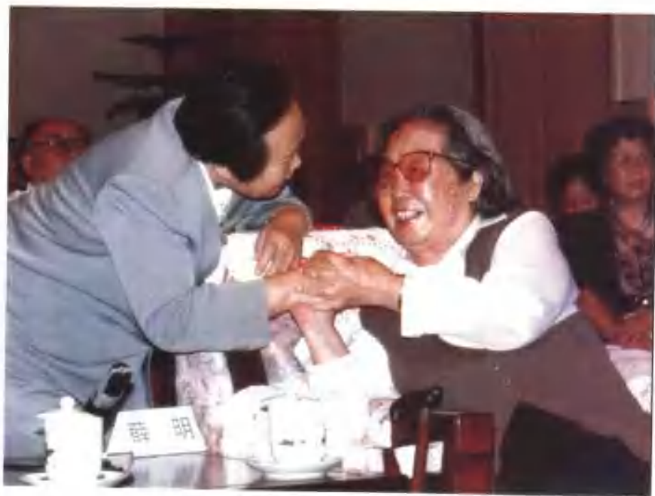
与薛明（贺龙元帅夫人）在一起