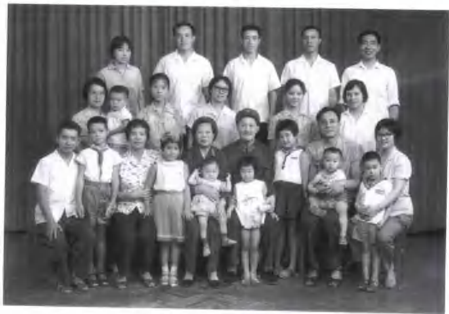
1979年和丈夫洪学智与子孙在北京团聚