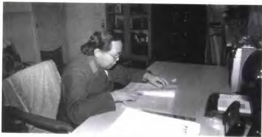
任总后勤部管理局顾问时在办公室工作