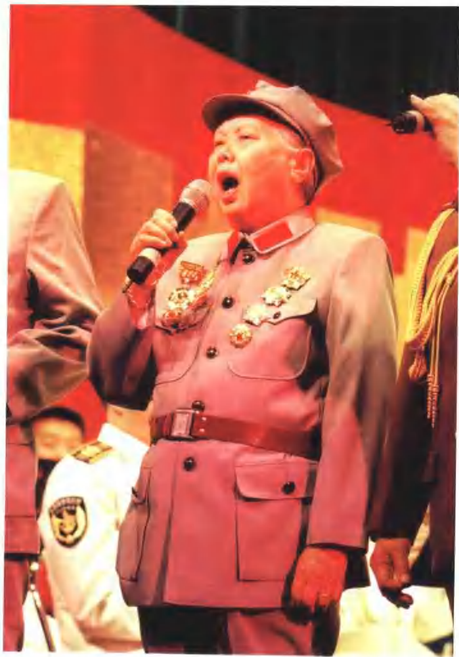
参加总后勤部老干部合唱团演出