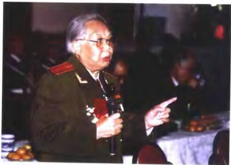
1988年在授予红星功勋荣誉章典礼上讲话