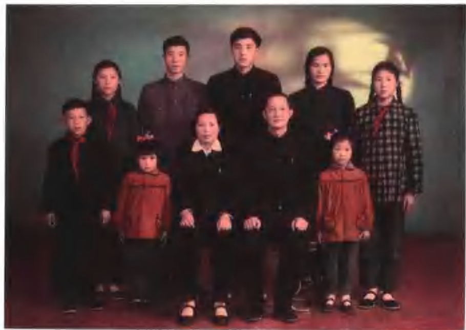
1960年丈夫洪学智蒙冤下放吉林前与子女在北京合影