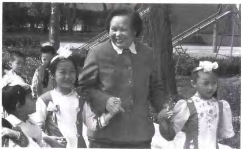
在五二幼儿园与儿童一起过六一儿童节