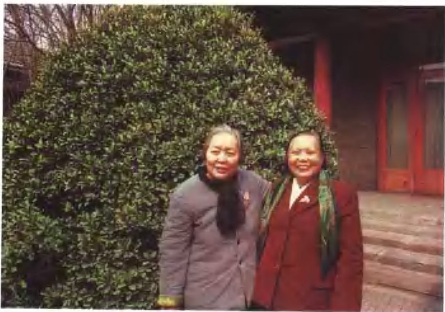
与汪荣华（刘伯承元帅夫人）在一起