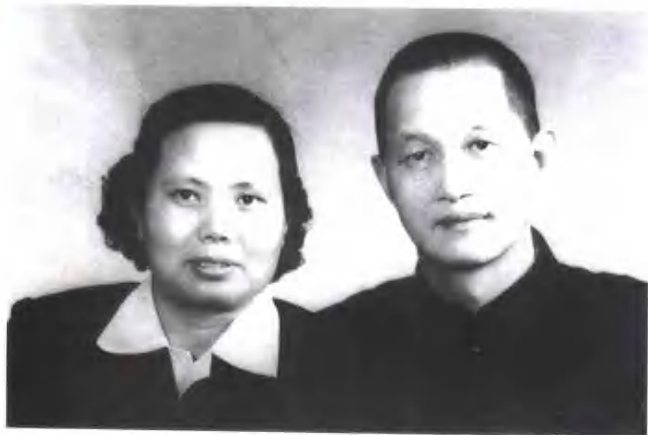
1960年后与丈夫洪学智在吉林合影