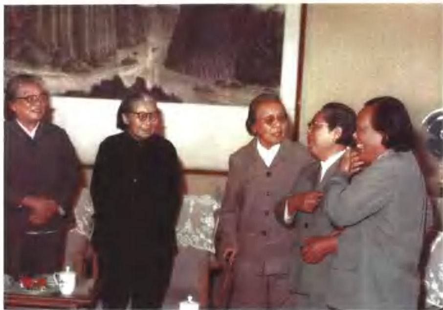
★ ★ ★ ★ ★ ★ 与全国政协副主席康克清（朱德元帅夫人）、李贞少将、张瑞华（聂荣臻元帅夫人）、林月琴（罗荣桓元帅夫人）（从左至右）出席《女兵》开机仪式