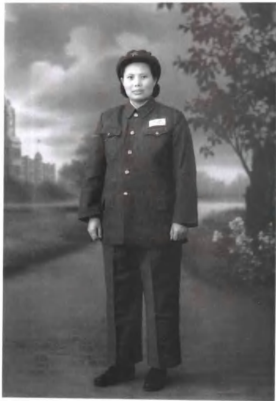
1951年在沈阳志愿军留守处时留影