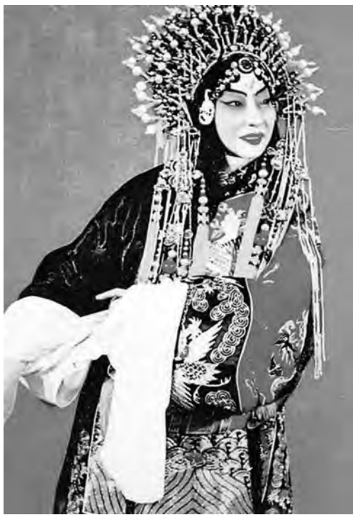
梅兰芳《宇宙锋》剧照