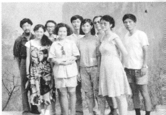
1990年9月于湖北神农架