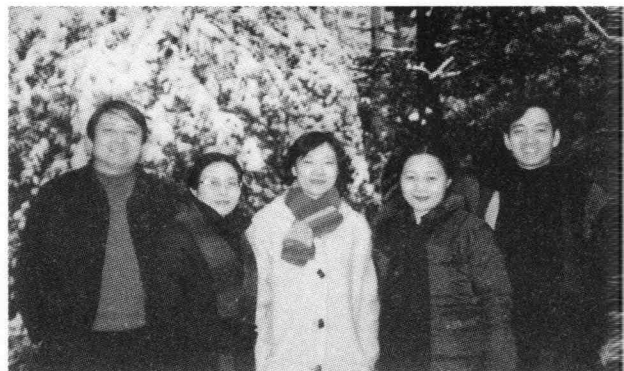
萌萌与兄弟姐妹在一起