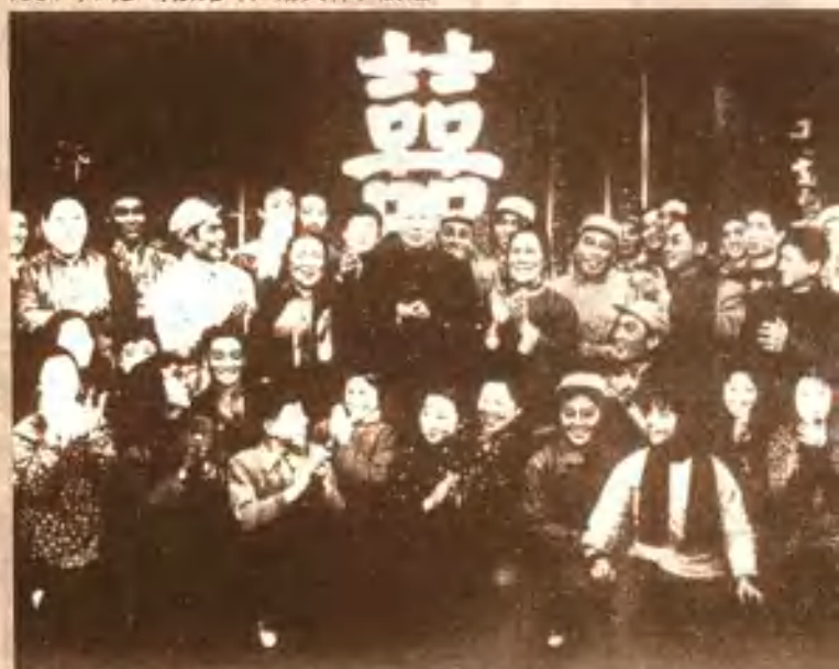
1964年刘少奇接见《芦荡火种》剧组