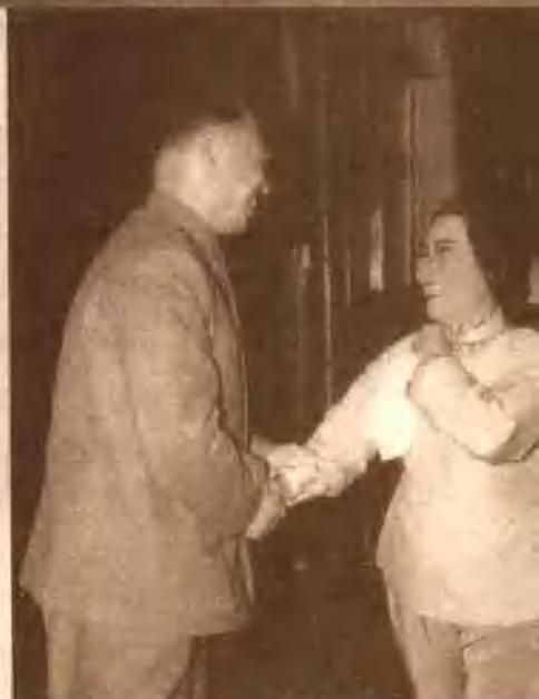
1963年底彭真接见《芦荡火种》剧组