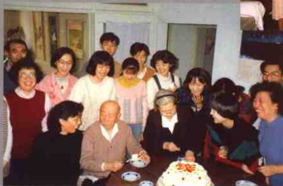
与儿孙们一起过年