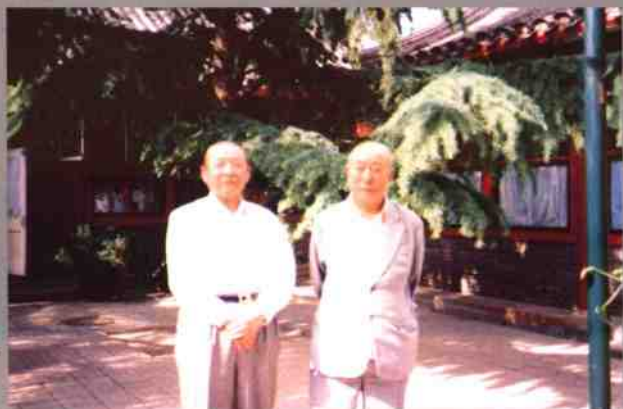
“文化大革命”后张秀山和习仲勋