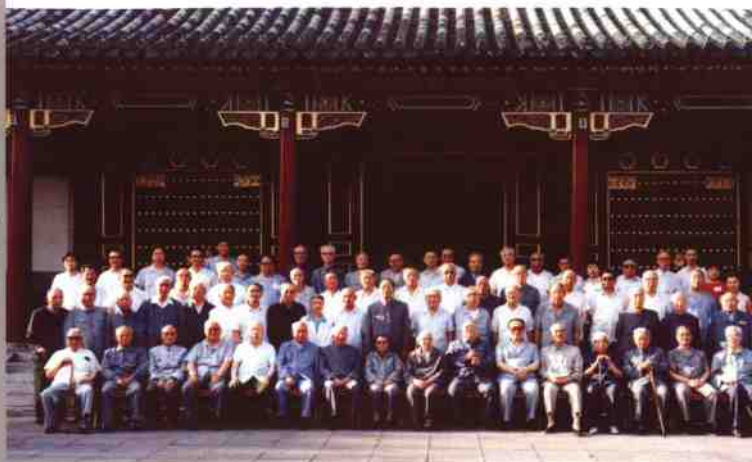
1989年，纪念“七一”座谈会江泽民与部分在京老同志合影