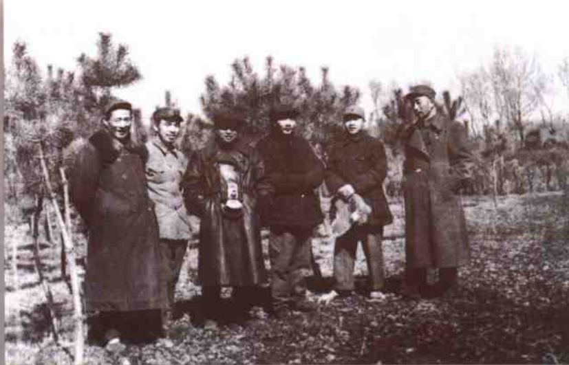
1947年，张秀山（右一）和陈云（右三）等在北满根据地