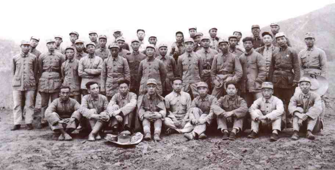
1939年秋，西北革命根据地部分干部在延河边合影。一排左起：崔田夫、刘景范、刘约三、康建民、高朗亭、黄罗斌、王世泰（左九），二排左起：高岗、高维嵩、李仁杰、习仲勋（左六）、曹力如、张文舟、张邦英、朱子休；三排左起：刘懋功（左二）、霍维德（左四）、张仲良、孔林甫、秦子杰、阎红彦、李合邦、李启民；四排左起：张秀山、张策、刘澜涛、王聚德（左五）、王兆相、王文彩、吴岱峰、唐洪澄、刘英勇