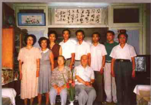
1992年，张秀山夫妇和子女