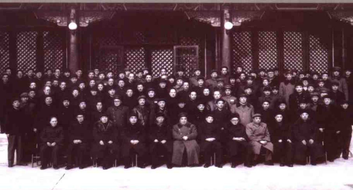
1954年，中共中央七届四中全会代表合影。后排右三为张秀山

1980年，中央领导同志在人民大会堂与全国知识青年代表会议的代表合影。前排左起：侯隽（左四）、张秀山、王任重、胡耀邦、王震、华国锋、李先念、余秋里、邢燕子