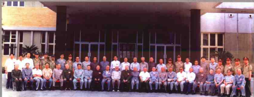
1986年7月7日，辽沈战役纪念馆建馆委员会第一次会议主任、副主任及委员合影：伍修权、张秀山、贺晋年、郭峰、刘振华、王首道、袁升平、万毅、王玉清、方强、左琨、刘震、刘仲葵、李运昌、陈雷、林一山、胡奇才、李中权、段苏权、曾克林、戴念慈、高克