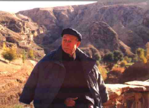
1993年10月 在陕北老家门前