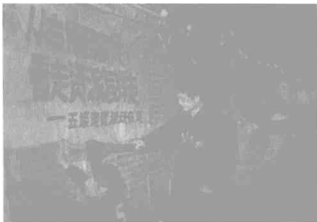
清华大学在“反击右倾翻案风”中的大字报