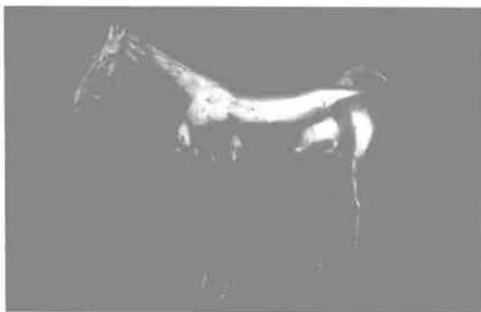
策马奔腾是琼瑶式的梦想。图为汉墓出土的鎏金马