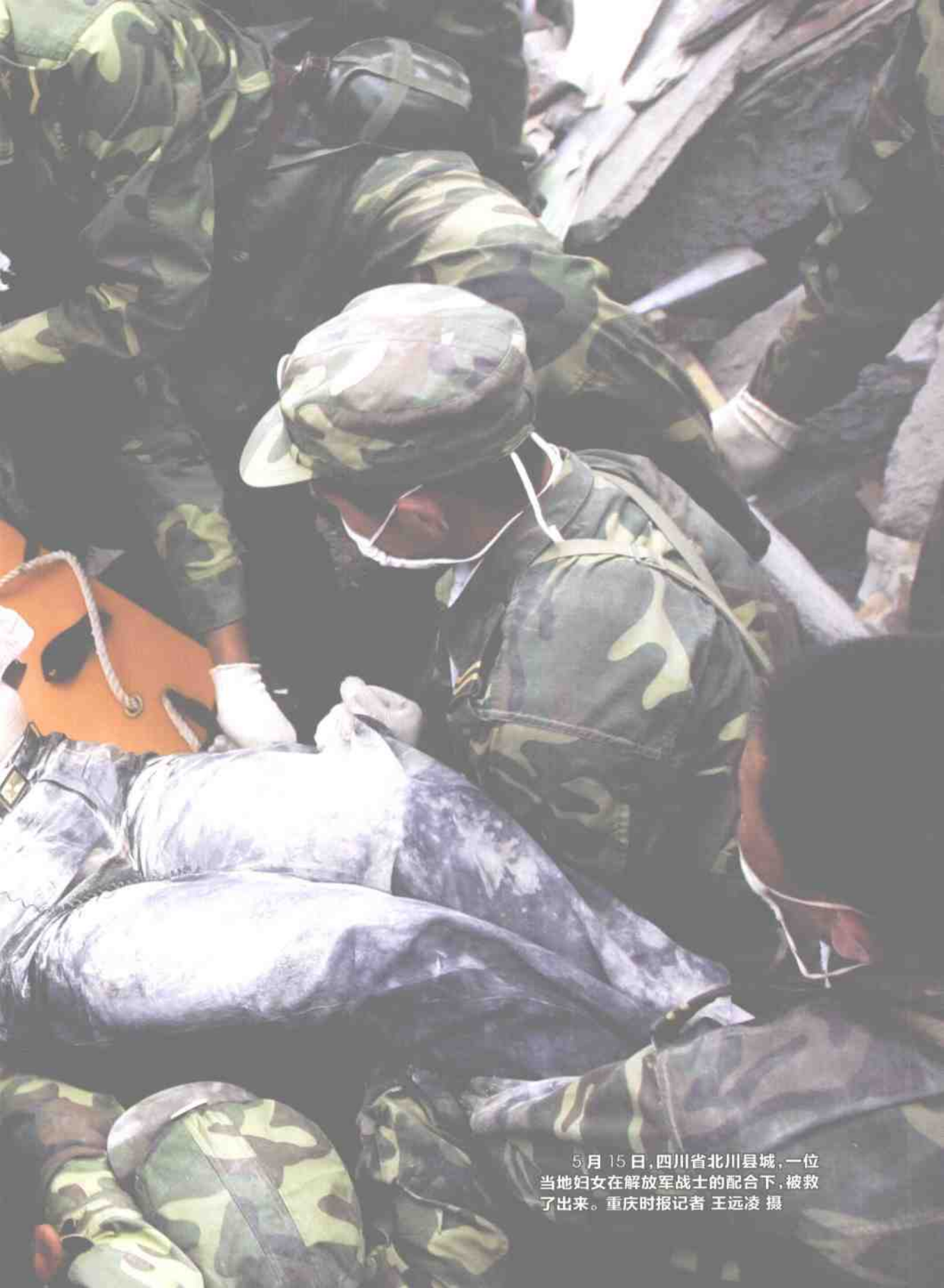
5月15日,四川省北川县城,一位当地妇女在解放军战士的配合下,被救了出来。