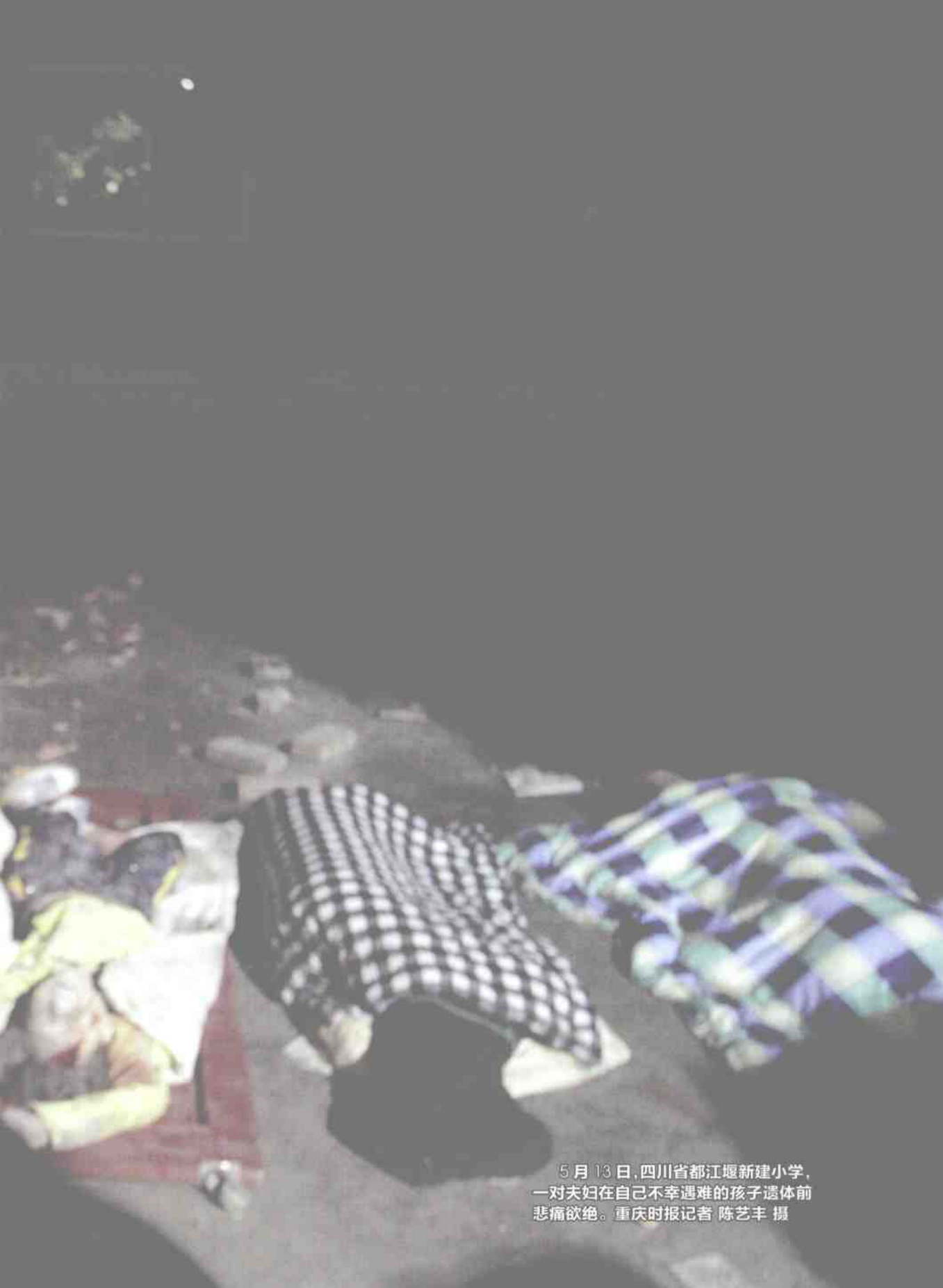
5月13日,四川省都江堰新建小学, 一对夫妇在自己不幸遇难的孩子遗体前 悲痛欲绝。