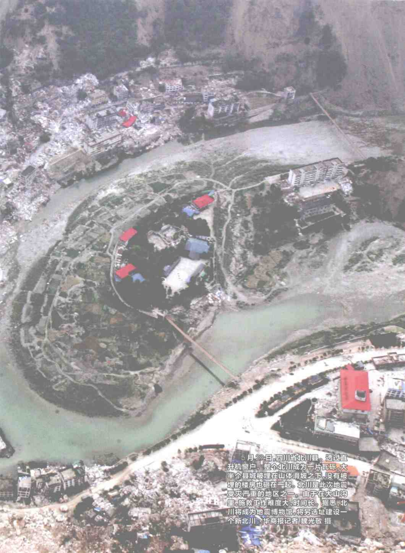
5月29日,四川省北川县。透过直升飞机窗户,整个北川成为一片瓦砾,大半个县城被埋在山体滑坡之下,没有被埋的楼房也砸在一起。北川是此次地震受灾严重的地区之一,由于在大山沟里,施救工作难度大、时间长。据悉,北川将成为地震博物馆,将另选址建设一个新北川。