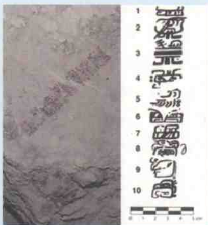
❖ 考古学家在危地马拉北部丛林中发现一座早期玛雅金字塔，经过几个月的考古研究后，考古学家宣布，他们在这座金字塔内发现了迄今最古老的玛雅文字，距今已有2000年。