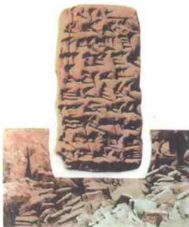
❖ 泥版和泥版上的楔形文字