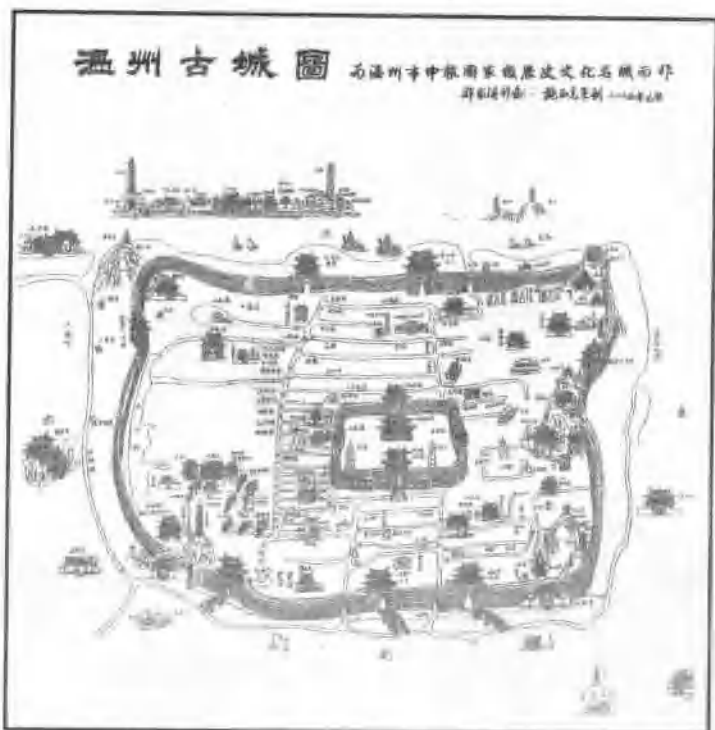
温州古城——白鹿城平面示意图 (施正克策划、郑家清作画)