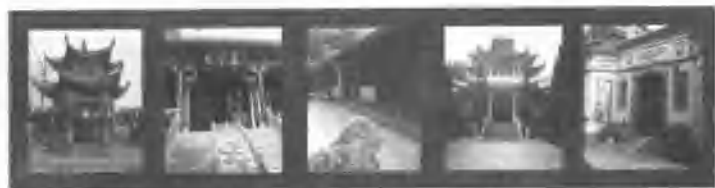
(一) (二) (三) (四) (五)