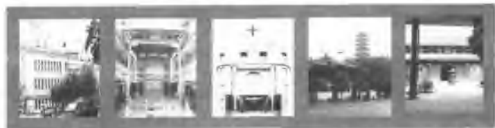
(六) (七) (八) (九) (十)