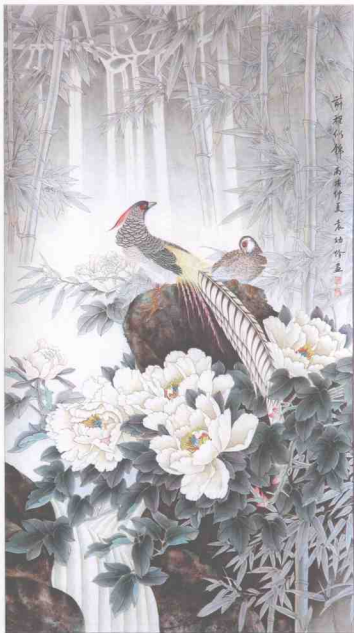
袁幼玲(女)《前程似锦》 110cm×56cm