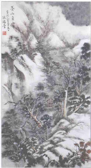
张瑞雪(女)《苍山负雪》 90cm×47cm