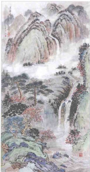
王惠林 《溪山清远》 130cm×68cm