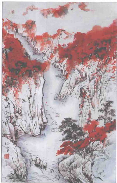
张瑞雪(女) 《秋山红叶》 75cm×47cm