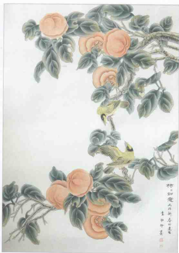
袁幼玲(女)《柿柿如意》85cm×59cm