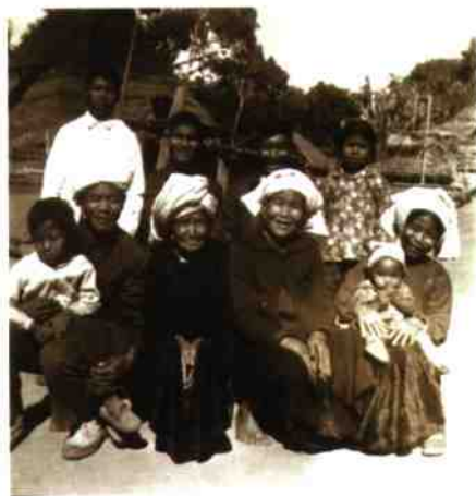
保卫厂夫人及其子孙