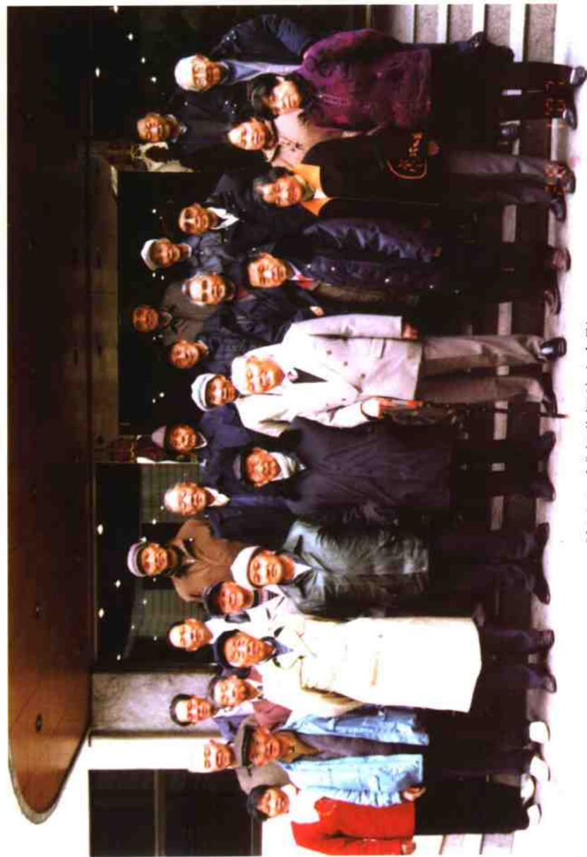
《佘山纪事》部分撰稿人合影