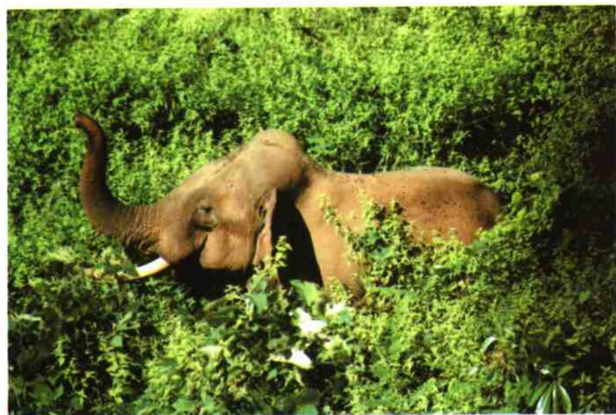
南滚河保护区中的亚洲象