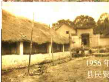
1956年勳董街上的 县民贸公司门市部