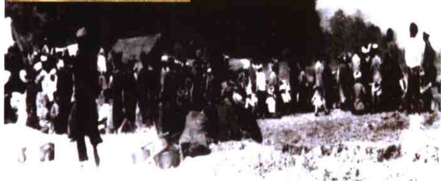
民国二十五年3月12日勳董赶街之情况