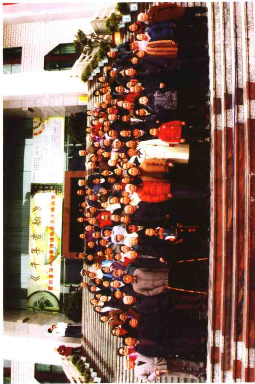
沧源佤族自治县在昆同志联谊会(地方)合影