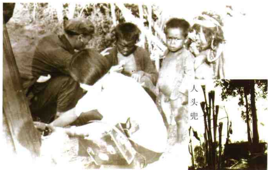
政府为佤族同胞治病