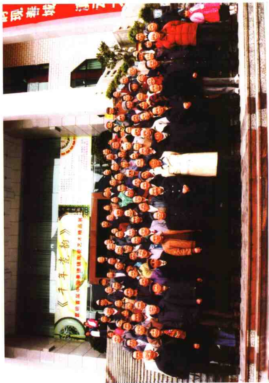
沧源佤族自治县在昆同志联谊会(原部队)合影