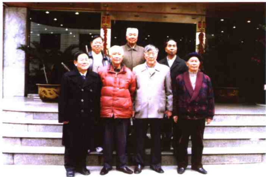
《佘山纪事》编委合影