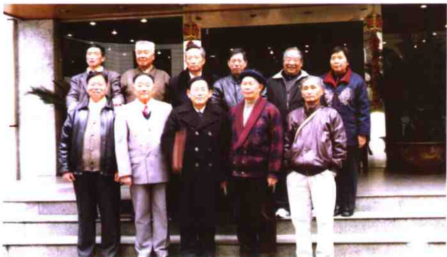
《佘山纪事》编辑合影