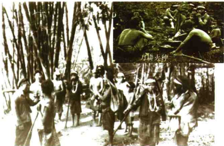
省民族工作队深入中缅边境的佤族原始部落