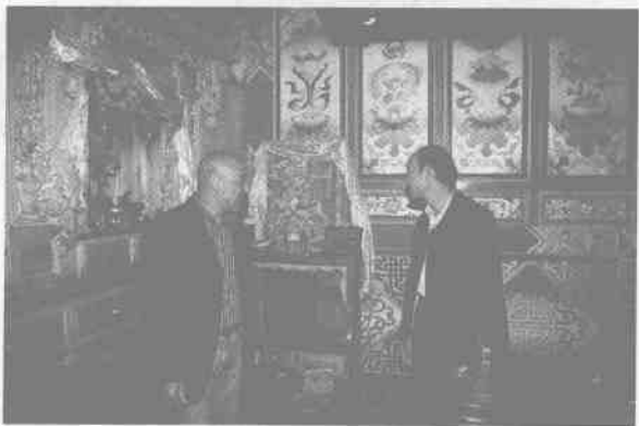
公司领导走访藏家

茶马古道在云南境内约两千公里,几乎贯穿整个云南省,完全靠马帮一步一步行走,因不少路段十分艰险,单程一