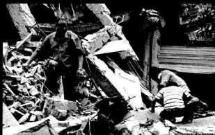
破坏力相当于唐山地震 截稿时尚无汶川现场消息