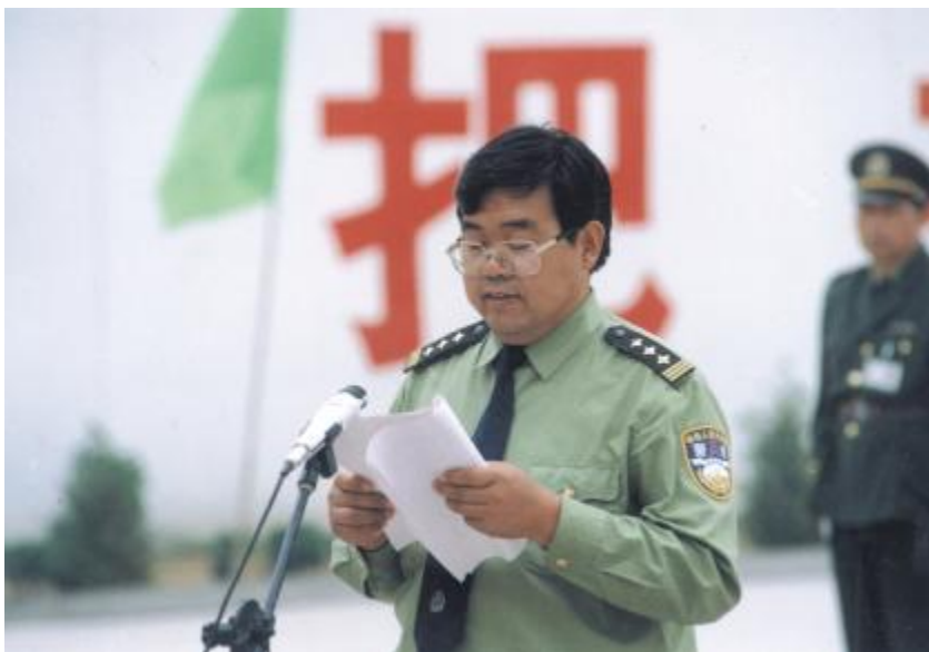
多年来关心支持狱内高等教育自学考试工作的原渭南监狱党委书记、监狱长，现监狱管理局副局长、益秦集团公司常务副总经理张敏忠。图为张敏忠2000年在渭南监狱省级现代化文明监狱命名大会上发言。