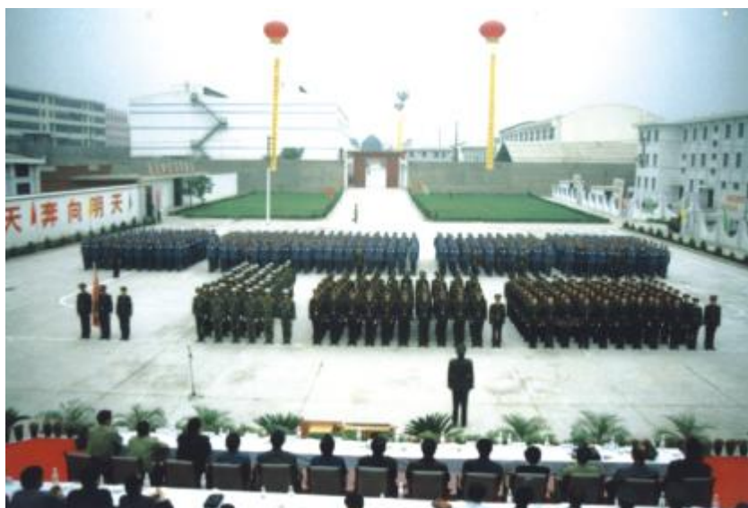
规范化管理活动中，向上级领导进行汇报表演的陕西省渭南监狱警察及服刑人员方阵。