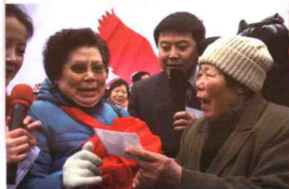
◎湘女石揭幕现场姐妹喜相逢