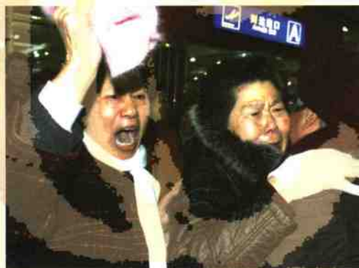
◎重逢的欢笑和泪水淹没了迎接现场!