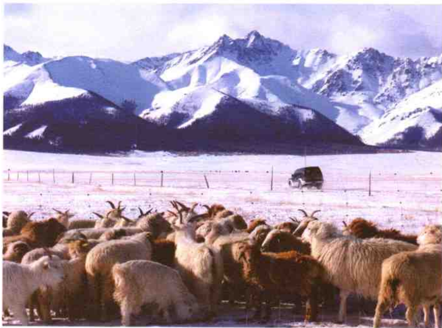
◎气势非凡的玛纳斯河谷←