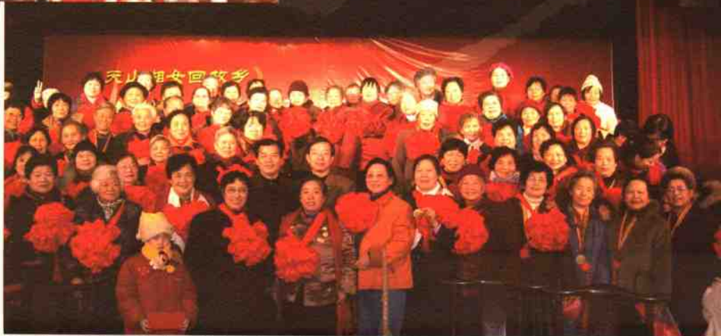
◎回湘湘女大合影(中立者左为长沙市副市长张湘涛 右为新疆生产建设兵团党委宣传部副部长曾建勇)↑