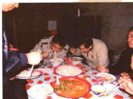
◎跑累了，一碗拌面也成了最大的享受↑