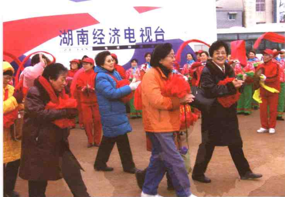
◎来自新疆的湘女代表入场参加湘女石揭幕仪式