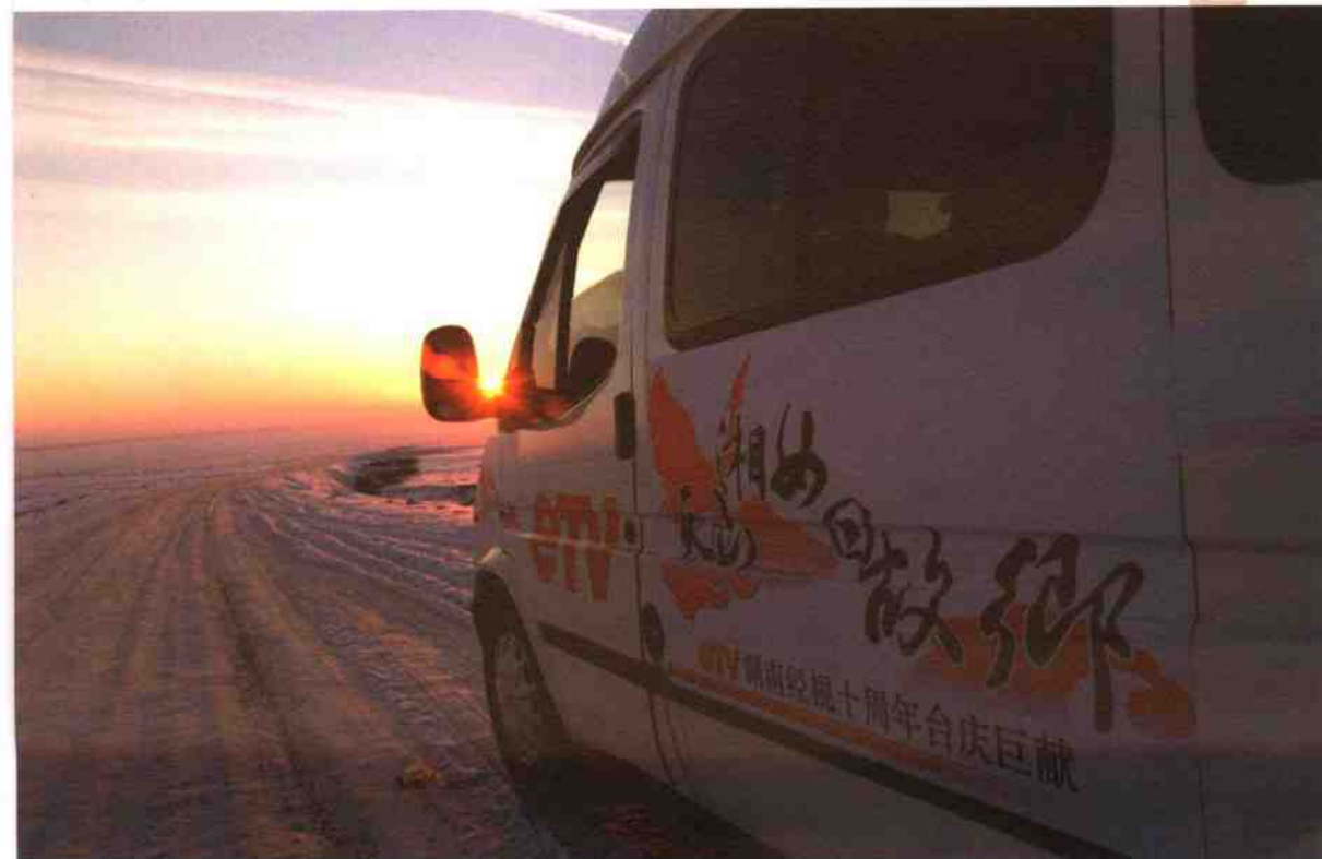
◎寻石车队穿行戈壁雪原↓