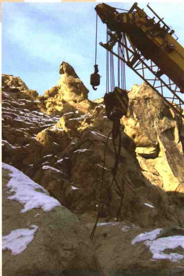
◎不远处，酷似湘女坐姿的巨石目送湘女石起吊↑