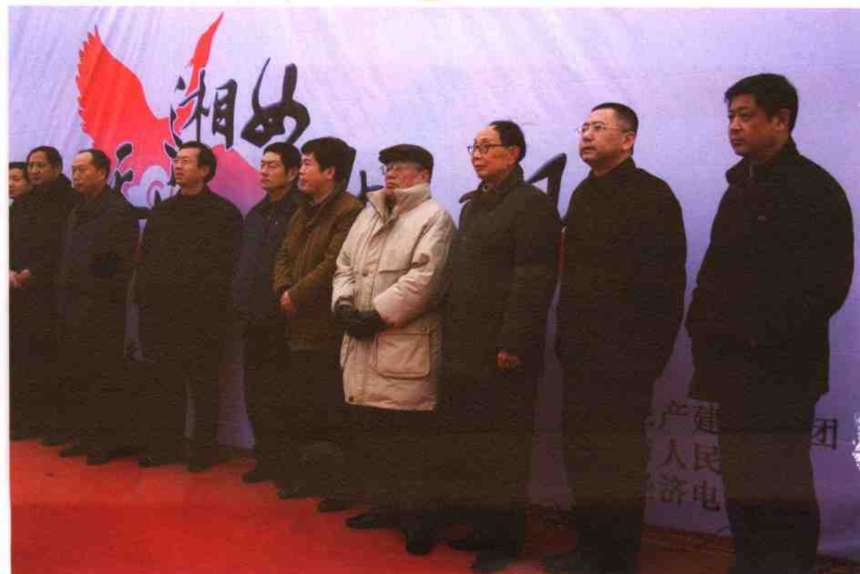
◎出席湘女石揭幕仪式的领导↓