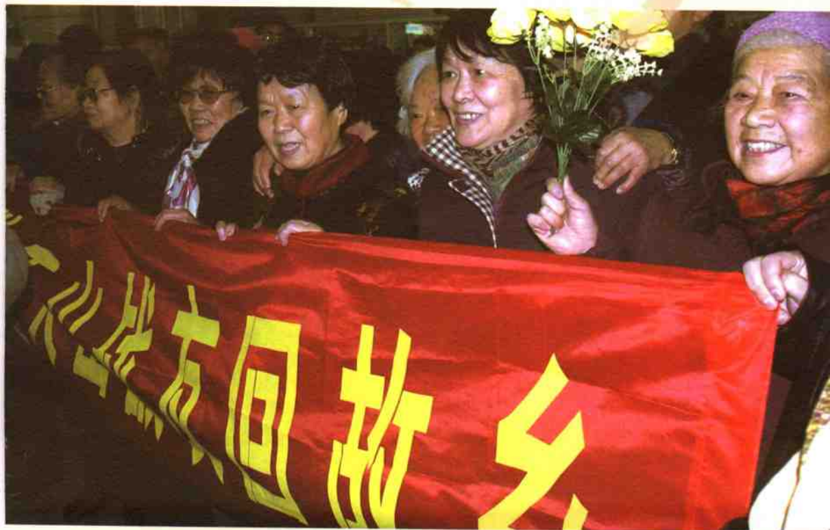
◎在激动和期盼中迎战友！