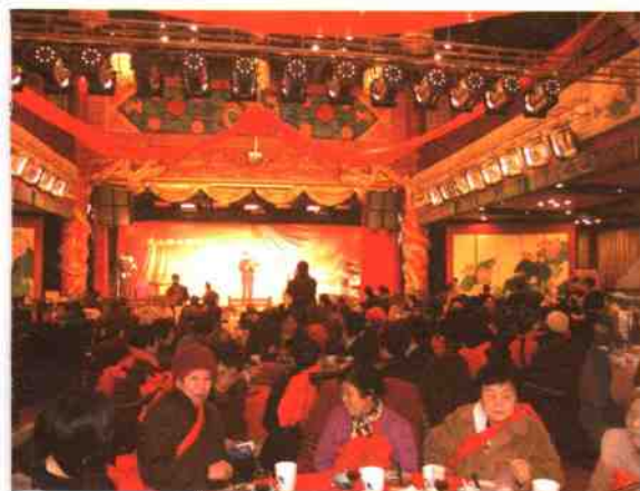
◎长沙市政府盛大招待酒会↑