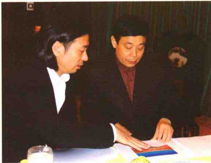
◎长沙市市长谭仲池(右)审看雕塑大师米丘设计的湘女园方案↑