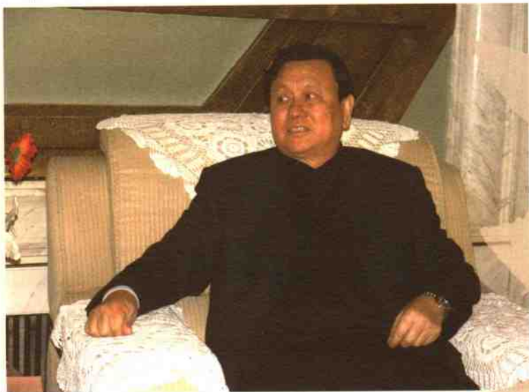
◎原兵团副司令员朱鉴凡↑