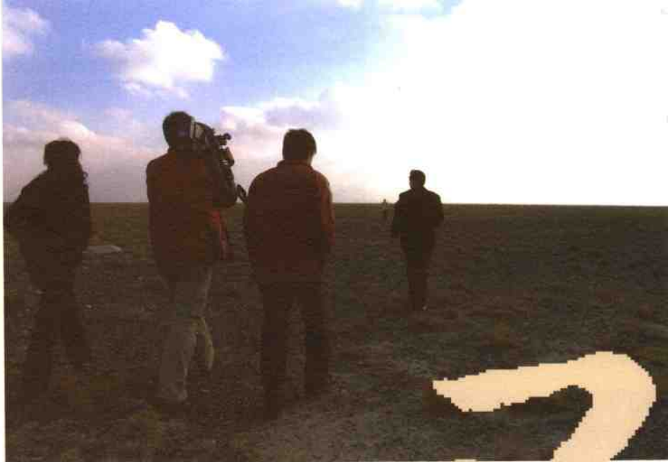
◎古尔图河流域寻石↑