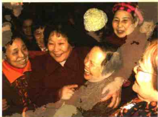
◎老战友重相逢笑开怀!