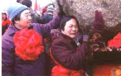
◎手抚巨石,感慨万千↑