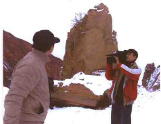
◎希望与失望交织，玛纳斯河谷寻石↑