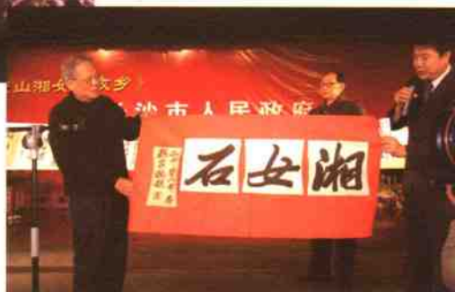
◎著名书法家亲笔手书湘女石↑