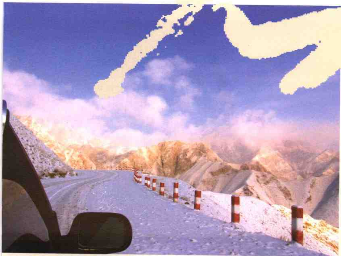
◎雪路入云端，和田寻石途中↑