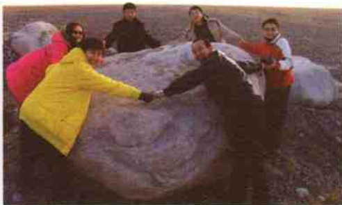
◎荒原巨石似从天降(古尔图河流域)↑