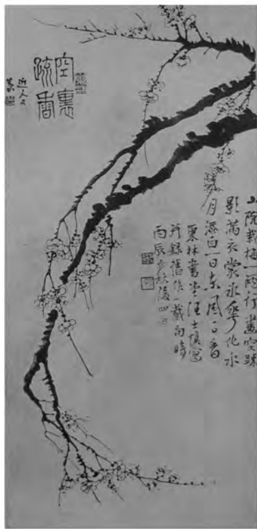
清·汪士慎《空里疏香图轴》

这首诗中的“苦吟”的“苦”，有两层含意，一是做诗做得很苦，二是吟诗的声音听起来有苦涩的味道。这“苦”字，画也是无法表现的。再来看触觉。如：