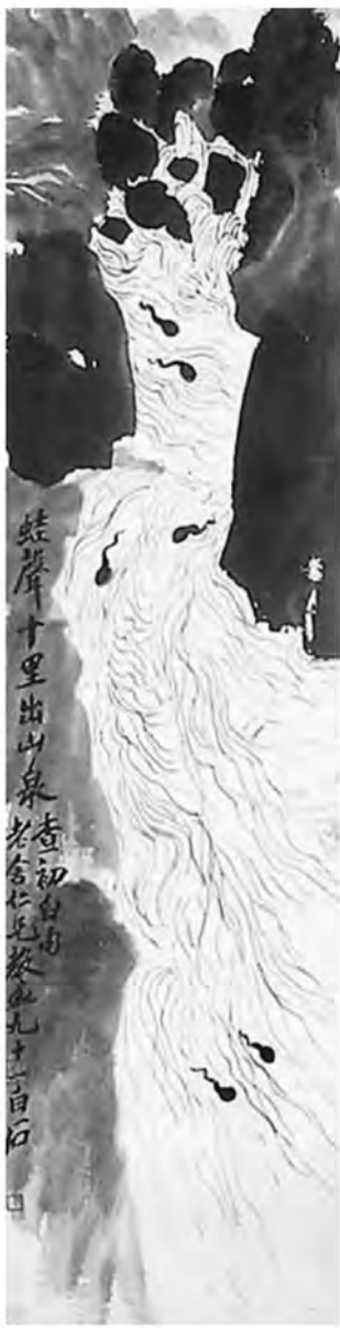
齐白石《蛙声十里出山泉》

“莫”即“暮”,这是写外地僧人,来到峨眉山,天色渐晚,但还未到达目的地,正在愁晚上无处住宿。这时,带领他们上山的当地僧人(头陀),手指前面有烟(暮烟或炊烟,未明说,可能两者兼有)的地方,并说,转过红霞四五湾就到了。“愁”是一种思维活动,画图中很难表现。如果是面部特写,还可以用愁容间接表达。像这种山水画,人物画得很小,则就无能为力了。进一步,如果要表述愁什么,像这里的“愁宿”,那么,即使作一面部特写,也无法如愿。另外,“只隔红霞四五湾”,画上是表现的,但这里用当地僧人的话说出,内含的意思比画上能表达的要多得多。如果只重复画