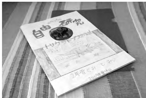
我家小学生动手绘制的第一本“书”——“关于三角恐龙”

从对下水道盖的观察，以孩子目前的能力，虽然只能了解到很简单的两点，但从这小小的两点中，却延伸出她的新兴趣：世界博览会几年举办一次？都有些什么内容？这种由小及大，一环套一环的延伸学习法，一旦孩子真正掌握，将一辈子受益匪浅。