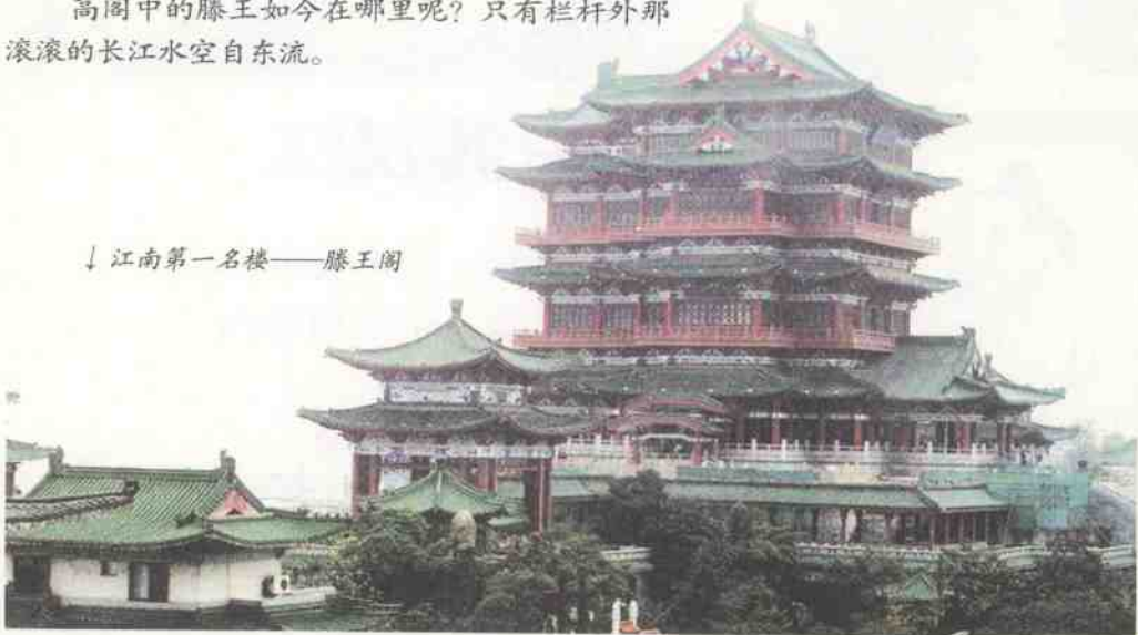
↓ 江南第一名楼——滕王阁