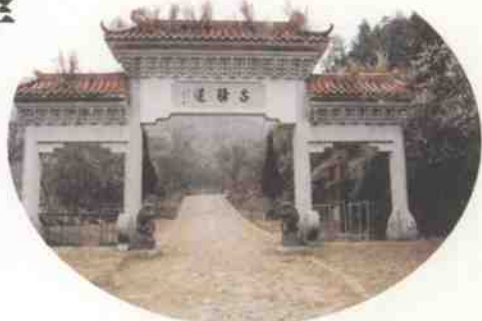
↑ 大庾岭下的梅关古驿道

阳月南飞雁，传闻至此回。 我行殊未已，何日复归来？ 江静潮初落，林昏瘴不开。 明朝望乡处，应见陇头梅。