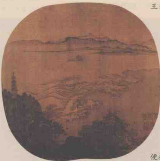
○钱塘秋潮图 南宋·夏圭

曹植有七步成诗的捷才，温庭筠有“八叉手”之美誉，而王勃亦有“四子成诗”的逸事。《云仙杂记》中记载，王勃和人下围棋，每下四个子，便作诗一首，还兴犹未尽地对人自矜道：“我真是天才啊，瞬间一心多用，还能游刃有余。”王勃写文章还有个“打腹稿”的习惯为人所称道。每次他在接到要写碑颂的活儿时，便先把笔墨纸砚等文房四宝准备好，然后畅饮一番，拿着被子蒙头大睡。醒来的时候，便操管疾书，一气呵成，文不加点。