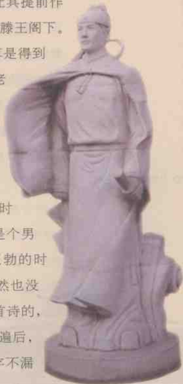
○滕王阁下的王勃 雕像

历史上关于王勃参加这次宴会的演绎版本很多，罗隐的《中元传》里便说了这样一个故事：说王勃随舅舅游江的时候，遇到一个老叟，提前告知其次日将要发生的事情，并让其提前作好准备，酝酿文章，同时又用神力把他的船提前送到了滕王阁下。于是便有了滕王阁上的那一幕。由此看来，王勃也算是得到神仙的成全了。从滕王阁出来后，王勃再去找那个老叟时，老叟便给他看相，说他“子神强骨弱，气清体羸，脑骨亏陷，目睛不全。秀而不实，终无大贵矣”，预言他不得寿终。王勃自然是老大不高兴，但后来果然应验。看来这命相学的确是不可小觑。隋唐之际的著名相术大师袁天罡曾在武则天还在襁褓中的时候为其相面，说她龙睛凤颈贵不可言，断言如果她是个男儿身的话，日后当君临天下。估计这神仙在帮助王勃的时候心想：要死也让你做个饱死鬼，暴得太名后，自然也没有遗憾了。又有说王勃《滕王阁序》中本来没有这首诗的，他写完序，当时在场的一位过目不忘的嘉宾，看完一遍后，瞬间目诵成忆，便说这篇文并非王勃原创，于是一字不漏