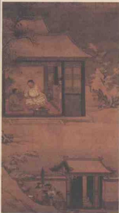
2 ○雪夜访普图 明·刘俊

《唐人事迹汇编》中记载了这样一个故事，说“王绩知天下将乱，藩部法严，一日叹曰：‘网罗高悬，去将安所？’出所受俸钱，积于县城门前，托以风疾，轻舟夜遁”。这或许可以作为本诗的一个间接的参考资料。适值隋末乱世，天下枭雄竞起，王绩能够急流勇退，不失为明哲保身之举。王绩为人性情豪放，洒脱不羁，绝对不是一块从政的料，但却有着与生俱来的诗人的潇洒气质和隐士的林泉高致。《野望》大约便是其退隐躬耕时的作品。诗人都有悲秋的情怀，王绩自然也是属于传统悲秋派。在这样