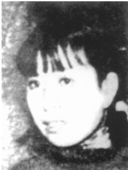
19岁的李云鹤,1933年刚到上海时所摄。这是已发现的江青最早期的照片。

由神》导演司徒慧敏的。那时为了让你在 上海滩站稳脚跟,我曾经不惜一切在《影坛》杂志上发表文章,吹捧你演的那个小女兵。阿苹,我写的那篇题为《别践踏了蓝苹》的影评,与其说是为了让世人都了解你,还不如说是在为你大声呐喊助威呀!那时,你不是说:今生就是化成了灰,也不会忘记我马季良吗?怎么时间刚刚过了不到一年,你就反面无情了呢?”