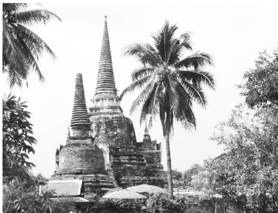
阿瑜陀耶城遗址 (笔者摄于2003年10月25日)

兰甘亨去世之后,素可泰王朝逐渐衰落,而其南方以华富里为中心的王国罗斛(Lavo)逐渐兴起,合并了地方上的素攀政权。1350年,罗斛的乌通王战胜了北方的素可泰王朝,将首都迁至阿瑜陀耶城,建立阿瑜陀耶王朝(Ayutthaya) ① ,他作为开国君主,自称拉玛铁