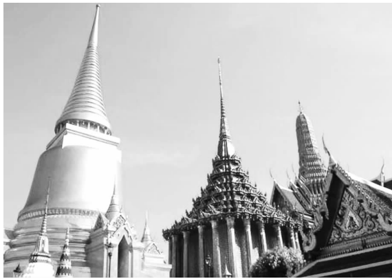
金碧辉煌的曼谷大王宫

开始向现代化国家转型，最终成功地成为英法两国势力的缓冲国，保住了独立的主权地位。泰国也是亚洲除日本之外唯一未沦为西方殖民