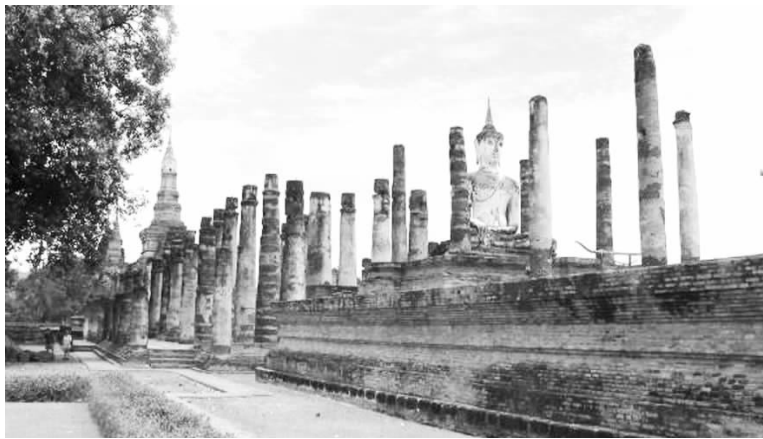
素可泰王都旧址 (笔者摄于2004年7月4日)

定都于清迈 ① 。孟莱王雄才伟略,其治下拥有强大的军队、发达的农业、手工业和建筑业,他还制定了《孟莱法典》,使兰那泰成为泰北最强大的国家。兰那泰吞并了泰北地区的孟人国家哈利奔猜和另一个泰人王国帕耀,与中部的泰族政权素可泰和阿瑜陀耶长期并立,并多次与西边的缅甸和东边的老挝发生战争。孟莱王死后,兰那泰开始盛极而衰。1558年,兰那泰沦为缅甸的附属国。1584年,中部泰族的阿瑜陀耶又把它从缅甸手中夺回,接下来缅甸和阿瑜陀耶又交替控制该地区,直至1767年阿瑜陀耶灭亡。1774年,清迈、喃邦和喃奔宣布脱离缅甸控制,向中部暹罗吞武里王朝效忠,并于次年组成联军打败缅甸,彻底结束了缅甸人在兰那地区的统治。1803年曼谷王朝正式把清迈并入暹罗版图。由于兰那泰的清迈政权建立时间最早且长期偏安一隅,因此较少受到外部环境的干扰和影响,也较好地保留了大量属于傣泰民族的传统民俗文化,这