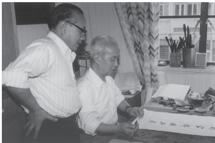
胡公石，著名标准草书 书法家，中国标准草书学社 原社长、宁夏书画院院长、 宁夏文史研究馆馆长。