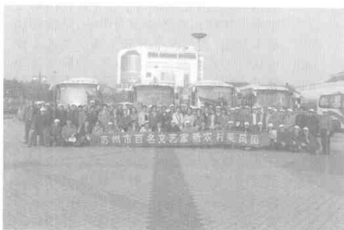
苏州市文艺家新农村采风

1978年党的十一届三中全会犹如一声春雷,驱散了笼罩在祖国大地上的重重阴霾,拨乱反正,正本清源,党领导人民实行改革开放,引领中国这艘巨轮绕过暗礁,调整航向,乘风破浪,驶向中国特色社会主义目标。在党的正确的文艺方针指引下,苏州文联于1979年恢复活