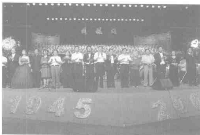
《国魂颂》——纪念抗日战争胜利60周年大型交响合唱音乐会

坚持以人为本的原则,尊重、理解文艺家。要关心文艺家的创作、学习和生活,切实维护文艺家的合法权益。要在改善待遇、提供经费、展示成就、传承艺术等方面为文艺家尽心竭力地办实事、解难事,帮助文艺家解决实际困难。要重视对中青年文艺人才的扶持和培训,坚持举办文艺新人的展示展演和各类比赛,举办已取得一定成绩的艺术家人作品展、展演和研讨会,为他们的进一步提高