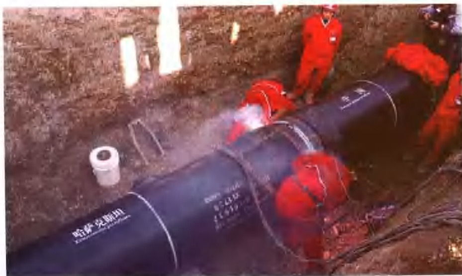
2005年11月14日中哈管道成功对接