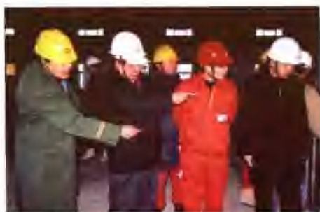
中国石油天然气股份有限公司A级综合质量大检查专家组在阿拉山口首站检查