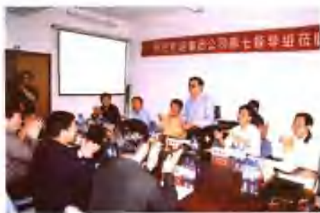
中国石油天然气集团公司共产党员先进性教育第七督导组领导到阿独线督导