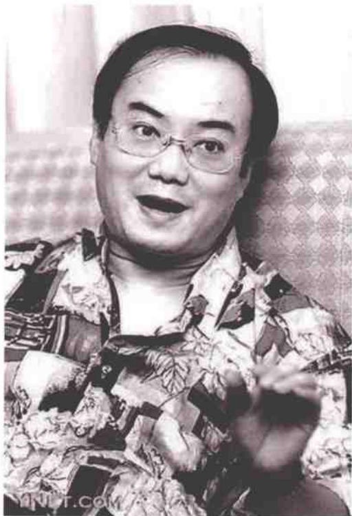
◎ 现年 55 岁的温瑞安英姿飒爽，谈笑风生，他是台湾新武侠的殿军之一，被大陆网友尊称为“温巨侠”。

后《绝代双骄》、《铁血传奇》（即《楚留香传奇》）、《多情剑客无情剑》相继出版，古龙的声望日渐高涨，很快超过了其他对手，成为台湾武侠第一人。70年代开始，借着《楚留香传奇》的余韵，古龙接连发表《萧十一郎》、《欢乐英雄》、《流星·蝴蝶·剑》、《大游侠》（即陆小凤传奇系列）、《七种武器》等作品，每一部都堪称绝品，成为台湾武侠界的一颗颗重磅炸弹，彻底击败了其他对手。至此，虽然还有一些作家在坚持创作，但基本上都过了创作的全盛期，无人能和创造力如此旺盛的古龙对抗。读者们也只认古龙为武侠第一家，其他作家的小说销售量根本无法与古龙相比。