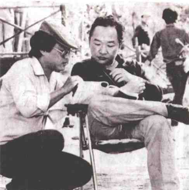
◎20世纪70年代的古龙（图右）在武侠小说界已经获得巨大成功。鉴于当时武侠电影的兴起，1978年古龙组建了宝龙电影公司，向影视界发起冲击，既当编剧又当导演，拍摄《楚留香》、《小李飞刀》等影片。

他对古龙的启迪也不可忽视。柳残阳、云中岳、秦红皆有特色，在文坛上各自称霸一方：柳残阳1961年发表《玉面修罗》，引起关注，而后接连出版《天佛掌》、《枭中雄》、《枭霸》等作品，形成自己铁血刚猛的文风，他吸收郑证因的“帮会技击”传统，虚构出一个正邪纠结、冲突频仍的江湖世界。云中岳则走了一条历史武侠小说的道路，以完整呈现古代江湖社会时空场景为目标。从1963年发表《剑海情涛》开始到1968年《八荒龙蛇》达到顶峰，他的小说将历史真实和文学虚幻结合在了一起，凭借渊博的文史知识将武侠人物还原到历史之中，在描写武林争霸的同时又表现了各地风土人情、历史文化。可以说云中岳